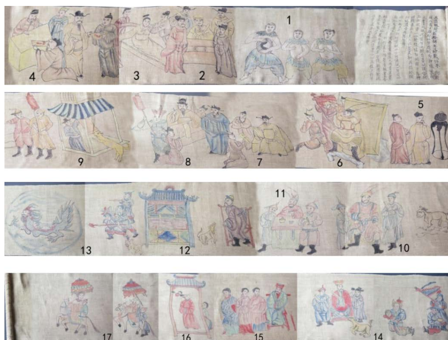
Figure 3. She nationality ancestral map in Lishui, Zhejiang Province [6] 图 3. 浙江丽水畲族祖图[6] ®

《高皇歌》盘瓠传说是盘瓠部落以犬图腾信仰为基础, 不断发展而来的(如图 3), 畲族人民对犬的崇敬正如汉人对龙的崇敬一般, 然而盘瓠传说的演绎受到“犬辱文化”、汉文化等影响, 盘瓠传说也在时