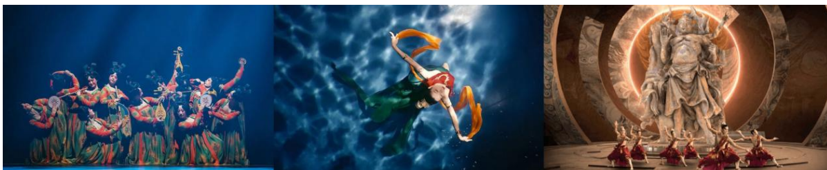
Figure 1. Henan Satellite TV “Tang Palace Banquet”, “Roselle Water Fu”, “Qixi Wonderful Tour” programs 图 1. 河南卫视《唐宫夜宴》《洛神水赋》《七夕奇妙游》节目 ①

随着数字时代的发展, 媒介的多样化使得视觉时代悄然来袭, 手机、电脑等新媒介已经在我们生活中起到了主导作用, 《高皇歌》口耳相传的传承方式就显得微不足道, 随着科技的进步和社会的演变, 人们的心理特征也随之改变, 在认知与思维上更偏向于视觉方式, 因此对文化的接纳和理解也日益依赖于图像的视觉化表达。在《高皇歌》传承乏力的形势下, 从保护与传播的视角来说, 通过视觉化设计对其延续并强化生命力, 不失为一种有效的可供探索的途径。