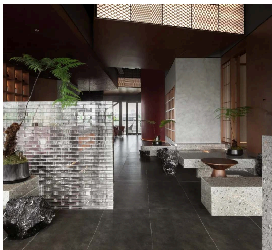
Figure 3. Glass brick screen partition in the small slow house tea space 图 3. 小慢居茶空间的玻璃砖屏风式隔断 ③

玻璃砖具有高透光性和选择透视性，于外墙设计更为常见。该材料有一种含蓄且朦胧的美感，一般应用在餐饮空间中，能够达到隔而不断的效果。如浙江嘉兴的小慢居茶空间，其半透明效果既能保证空间的私密性，又能用来遮隔且分割空间(图 3)。