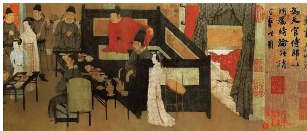
Figure 1. The screen depicted in the “Han Xizai Night Banquet Map”