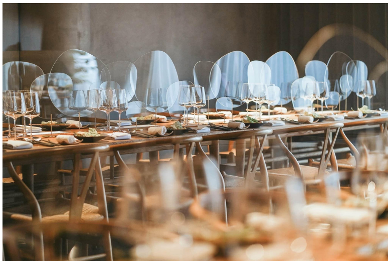
Figure 4. Acrylic desktop partition screen 图4. 亚克力桌面隔断屏 ④

例如在受疫情时期影响下的餐饮空间，在公共场所就餐的人们对有隔离飞沫传播功能的装置的需求愈发强烈，东京一所婚礼派对中心的设计师就利用亚克力和黄铜创作了一款有保护功能的桌面隔断屏(图4)。考虑到该场所的氛围，设计师尽可能的使用典雅的设计手法来消除其自身的存在感。该隔断屏分三个尺寸，使用时将其进行随机排列，就像是装饰在餐桌上的花，起到一定装饰性的同时也能够将飞沫挡在安全距离之外。