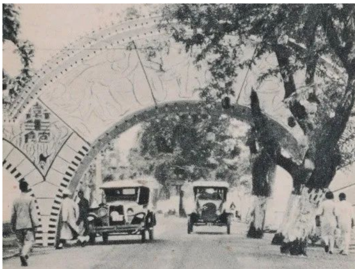
Figure 4. Silk museum entrance 图 4. 卫生馆入口 ®

5) 音乐亭与卫生馆入口(图 4)。“音乐亭”和“卫生馆”的入口有几分相像,同为拱门,但在具体形态上却有不同。音乐亭入口层叠半圆拱中心放射状造型,卫生馆入口采用的一个拱券加半拱造型,卫生馆拱状入口表面有装饰线条,构成了“新艺术运动”时期标志性的放射状视觉效果。