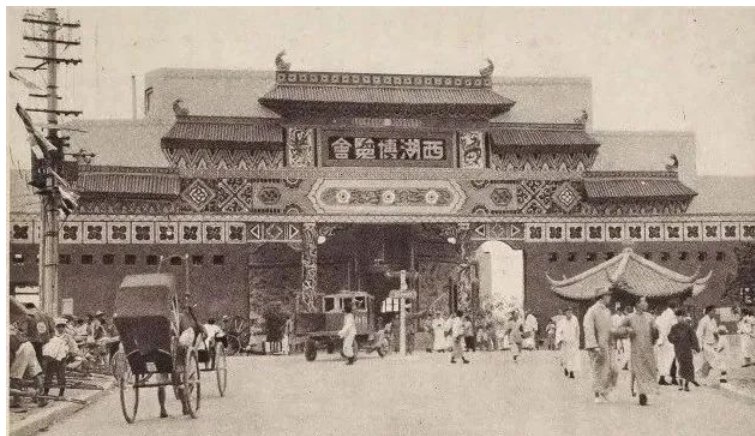
Figure 1. Entrance building interior 图 1. 入口建筑 ①

在国际博览会的内部设计方面, 中国常常采用宫殿式风格(图 1)。这种设计风格在中国展馆中地应用, 实际上是中国政府在国际舞台上传达国家形象和立场的一种方式特别是, 中国借助中国牌坊的形式, 展示了国家自尊心以及本土产业的重要性, 这种中国牌坊设计并非一时之选, 它在多次国际博览会中都得到了应用。在国内举办的各种展览中, 其场馆的设计往往都是以本国产品为主题的, 这设计背后的目的是为了抵制外国货物, 以促进本土工商业的发展。这一做法不仅强调了本土产业的重要性, 还反映了博览会作为一个场所, 用以表现民族主义情感的重要性。