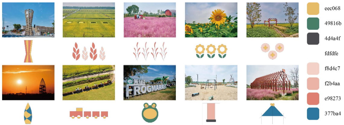
Figure 5. Extraction of auxiliary elements for the Qingfeng Village brand