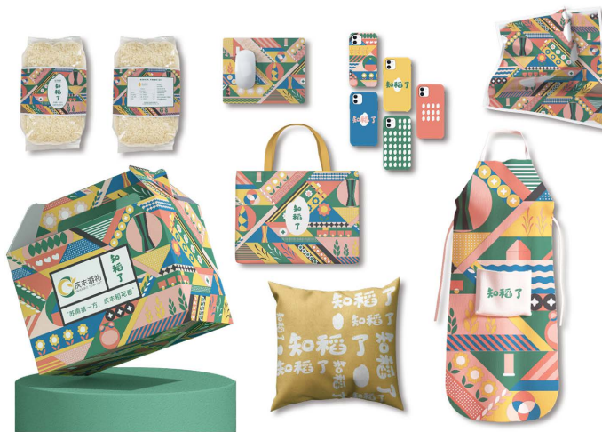
Figure 7. Qingfeng rice packaging design and peripheral cultural and creative product design

突显了庆丰村的自然景观和农业特色，具体如图 7。品牌名称为“知稻了”取自谐音“知道了”，一语双关，朗朗上口，希望借此提升庆丰稻米的市场认知度，扩大庆丰稻米的品牌影响力，为全域旅游发展注入新的活力。