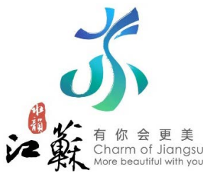
Figure 1. Brand LOGO of “Charm of Jiangsu”

“水韵江苏”品牌标识是一个代表江苏省文化旅游产业的符号，见图 1。标志以“苏”字的变形为视觉基础，辅以“水”的流动之感。“苏”字代表品牌标识的直观形象，“家”的概念给人宾至如归的感觉，“水”则象征着江苏省的广阔。江苏省汇聚来自四面八方的水，有一种旺盛的生命力。设计团队制作了信封、便签、名片、笔等一系列衍生产品，希望品牌标识得到更广泛的推广和运用。江苏站在新起点，面临新挑战。在新时代，江苏将通过省市协同、产业合作，以文化与旅游融合发展为重点。以此为契机，突出创新转型，加快文化和旅游强省的建设。一张崭新的名片，象征着江苏文化底蕴和旅游资源的丰厚。它将伴随着江苏省文化与旅游产业的高品质的发展过程而不断前进。成为对外交流的窗口，彰显江苏地域精神的独特魅力。