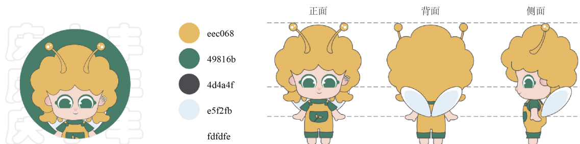
Figure 4. Qingfeng Village IP image design 图 4. 庆丰村 IP 形象设计 ②

些特点也正是庆丰村村民的精神面貌。精灵胸前的稻米图案是庆丰稻米文化的展现，大大的眼睛充满着好奇与活力，精灵耳朵上的小太阳花，有着积极向上的寓意，这些寄予着对庆丰村光明前景的美好祝愿。IP 形象的主色调延续品牌 LOGO 的黄绿配色，统一的配色加深视觉印象。