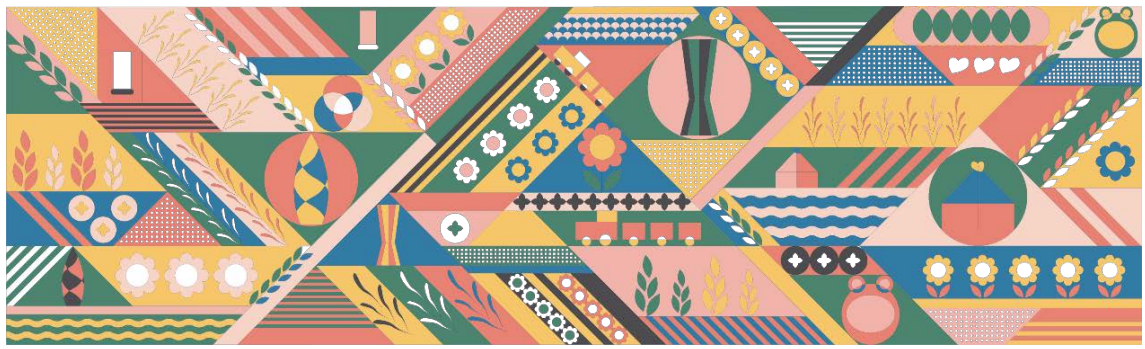
Figure 6. Qingfeng Village brand visual image construction