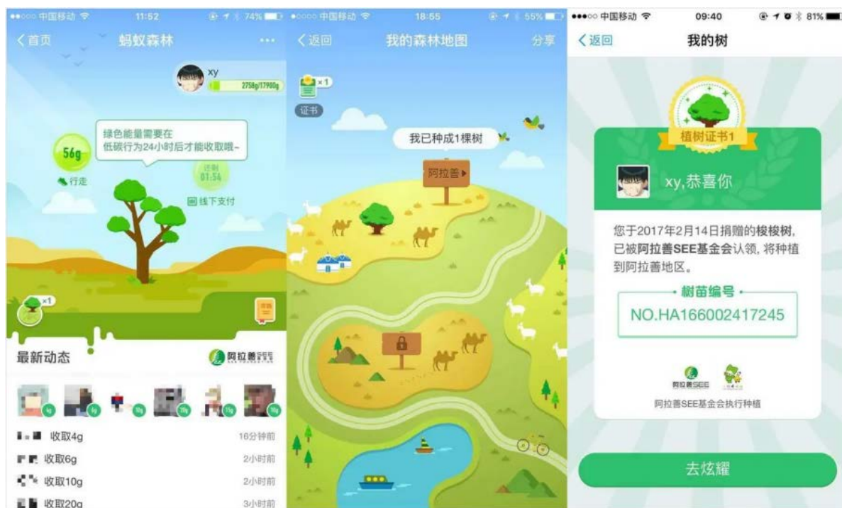
Figure 6. Ant Forest sustainable visual presentation

当谈到可持续设计在品牌可视化中的实际应用时, 蚂蚁森林(Ant Forest)是一个鲜明的例子见图 6。蚂蚁森林是中国支付宝推出的一项可持续性倡议, 旨在通过数字互动来鼓励用户关心环保和参与树木种植。其可持续理念在品牌可视化的具体呈现是数字可视化、社交互动的可视化、奖励机制的可视化和社会责任的可视化。