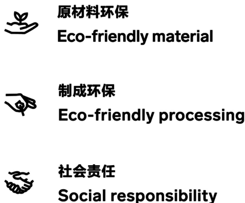
Figure 2. Klee klee visual elements in the brand 图 2. Klee klee 品牌中的视觉元素 ②

总之, 可持续设计和品牌视觉化之间的关系是为了将可持续性价值观融入品牌形象, 相互交织, 吸引有意识的消费者, 并在市场中建立可持续性形象。这有助于品牌实现经济和环保的双赢, 同时满足消费者的可持续性期望。