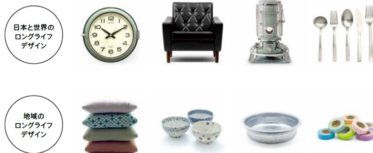
Figure 4. Long life design products from Japan and the world 图 4. 来自日本和世界的长效设计产品 ®