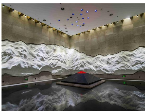
Figure 6. Northeast land of the “September 18” History Museum 图 6. “九·一八” 历史博物馆东北土地 ⑥