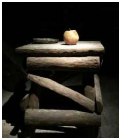
Figure 4. Art installation “The Story of an Apple” at the Memorial Hall of the War to Resist US Aggression and Aid Korea 图 4. 抗美援朝纪念馆“一个苹果的故事”艺术装置 ④