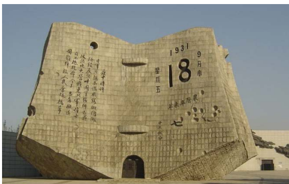
Figure 5. Remnants of the “September 18” History Museum 图 5. “九·一八” 历史博物馆残历碑 ⑤