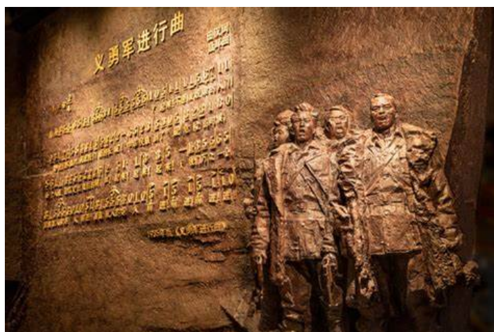
Figure 7. “March of the Volunteers” of the “September 18” History Museum 图 7. “九·一八” 历史博物馆《义勇军进行曲》 ⑦