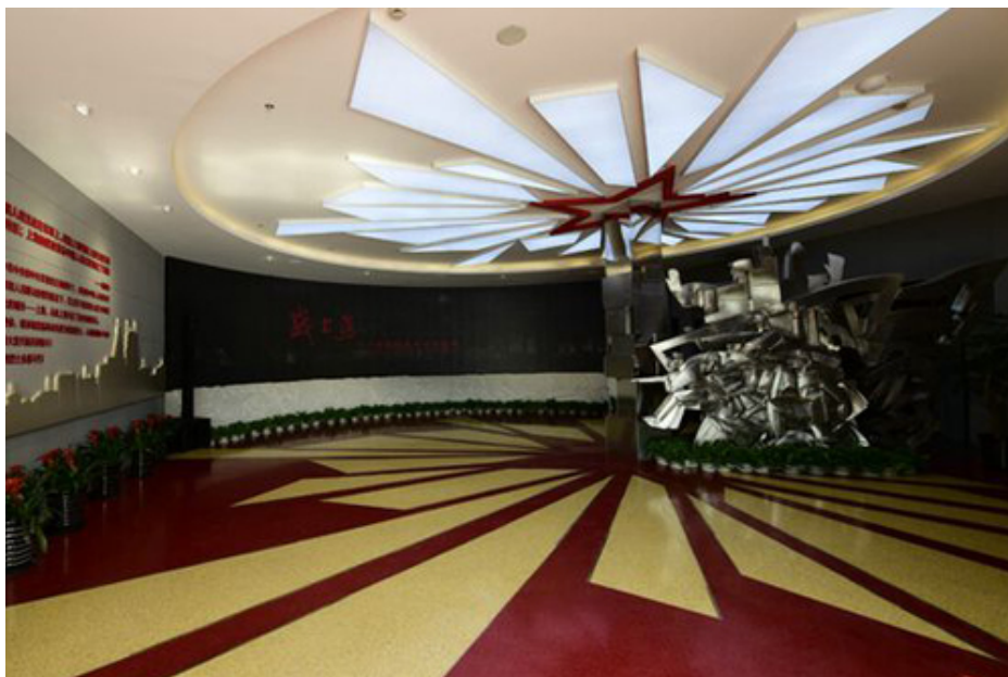
Figure 2. Main color matching of the exhibition hall of Shanghai Liberation Memorial Hall 图2. 上海解放纪念馆展厅主色搭配 2)

红色文化纪念馆的主体颜色搭配遵守了一定规则与原理,对纪念馆的本身属性进行关注,利用色彩来突出空间的中心,空间色彩的整体协调统一。譬如上海解放纪念馆主色调为红色、白色、黑色等(见图2),红色激情、热烈,白色平缓、庄严,黑色深沉、肃穆,这几种主色的搭配参观者很容易联想到革命等场景,既暗示了革命的流血牺牲,也象征着胜利的喜悦与激动;部分展厅用不同颜色灯光营造不同的氛围,红色的火光、黄色的土地岩石、绿色的草木等,不仅实现了与整体氛围的冲突,同时还营造了一种强烈的空间纪念氛围。上海解放纪念馆持续地对颜色的明暗程度、冷暖程度以及饱和度程度的改变进行探究,从而让空间的情感得到深化。在此基础上,结合参观者的心理,对其在不同的环境下所表现出来的颜色进行探索,并对其进行了美学上的优化。