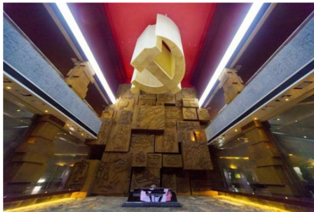
Figure 3. Shaanxi-Gansu border revolutionary base area memorial hall shining party emblem 图 3. 陕甘边革命根据地纪念馆光耀党徽 ③