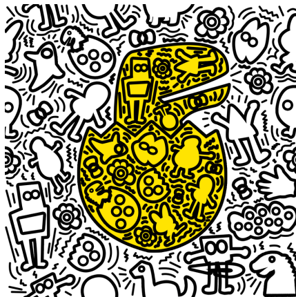
Figure 2. Decorative pattern 2 图 2. 装饰图案 2