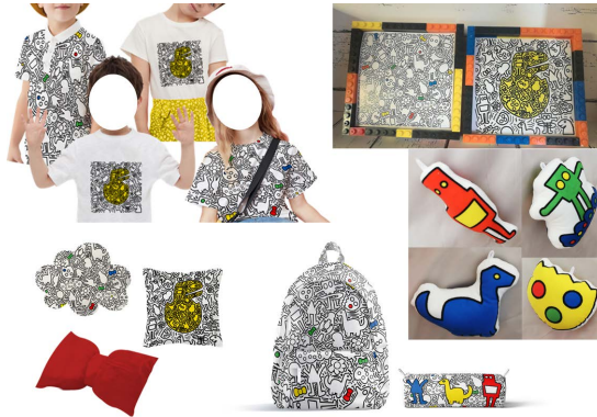
Figure 5. Graffiti elements of young children peripheral cultural and creative effect diagram 图 5. 幼儿涂鸦元素周边文创效果图