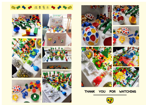
Figure 7. Children's play facility decoration and modelling display 图 7. 儿童游戏设施装饰与造型展示