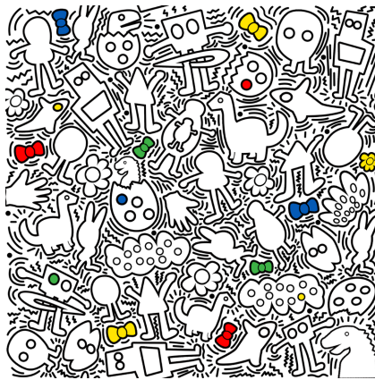
Figure 1. Decorative pattern 1 图 1. 装饰图案 1

以凯斯哈林和 Sam Cox 的形式结合幼儿涂鸦常见元素, 形成具有趣味性的图案, 如图 1、图 2。