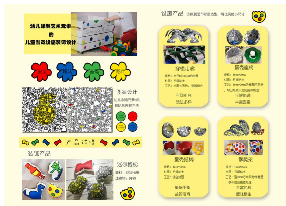
Figure 6. Children's play facility decoration and modelling display 图 6. 儿童游戏设施装饰与造型展示