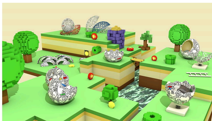
Figure 4. Children's play facilities scene effect diagram

幼儿涂鸦艺术元素的儿童游戏设施帮助儿童提高审美意识。选择凯斯哈里和 Sam Cox 的艺术形式，结合幼儿涂鸦中的元素，能够让儿童具有代入感，吸引儿童目光，同时能够让儿童在娱乐中享受“美”的乐趣，开拓他们的眼界，在娱乐中拓宽想象力，如图4。