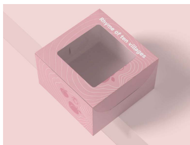
Figure 5. Packaging design of a single fruit and vegetable gift box 图 5. 单个果蔬礼盒包装设计