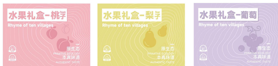
Figure 2. Main screen of packaging for ten villages and towns design 图 2. 十村乡韵包装主画面设计