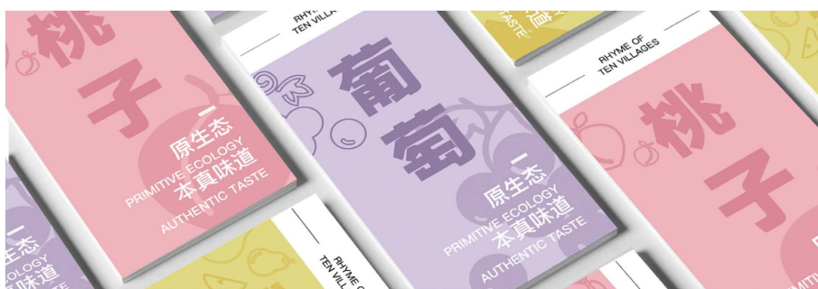
Figure 7. Fruit and vegetable introduction card design 图 7. 果蔬介绍卡片设计