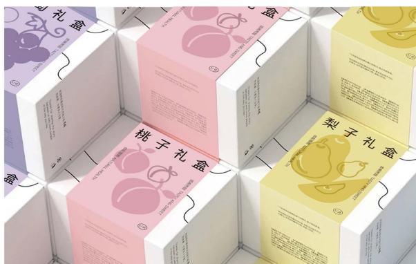
Figure 6. Packaging design of a single fruit and vegetable gift box 图 6. 单个果蔬礼盒包装设计