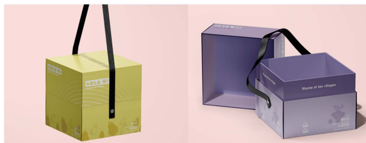
Figure 4. Packaging design of ten rhyme rural boutique gift boxes 图 4. 十韵乡村精品礼盒包装设计