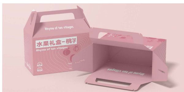
Figure 3. Ten rhyme rural packaging gift box design 图 3. 十韵乡村礼盒包装设计

所有的盒装产品均附有相关水果介绍的卡片(见图 7)，以增强包装的细节感，消费者可以将卡片作为书签，以此提升产品的曝光度。