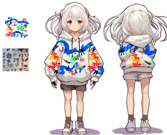
Figure 6. Dongba image graffiti dress hand drawing 图 6. 东巴形象涂鸦服饰手绘图 ®

在游戏服装中, 涂鸦元素进行创新型转变可以运用重新组合、重新定义和创造性的运用等手法, 例如, 将传统的涂鸦元素与几何图案或艺术风格进行结合, 正好也是遵循了趣味性原则, 可以为玩家带来更有趣和吸引力的视觉效果。