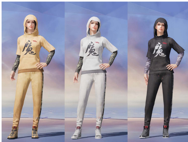
Figure 2. Game of Peace Elite Costume “Voldemort” 图 2. 游戏和平精英服装《伏地魔》 ②

头元素常被用作敌对势力、反派角色甚至是死亡的象征, 不仅可以与游戏中的敌对势力与冒险元素相关联, 同时也有助于建立自己的社群认同感, 从而能更有效地帮助玩家进入沉浸状态[5]。