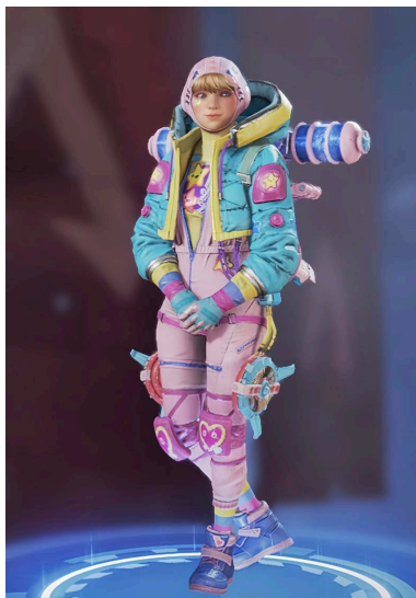
Figure 1. Watson's costume in game APEX 图 1. 游戏 APEX 沃特森服装 ①

见图 1, 在近几年最热门的射击类游戏“APEX”中, 沃特森(角色名)的服饰一身马卡龙色连体衣, 外套与整个服装的色彩采用多巴胺色系的搭配, 护膝是两个类似于川久保玲的涂鸦款爱心, 并且在胸前、肩膀两侧的口袋采用了星星的卡通笑脸, 充满了可爱童真的感觉。