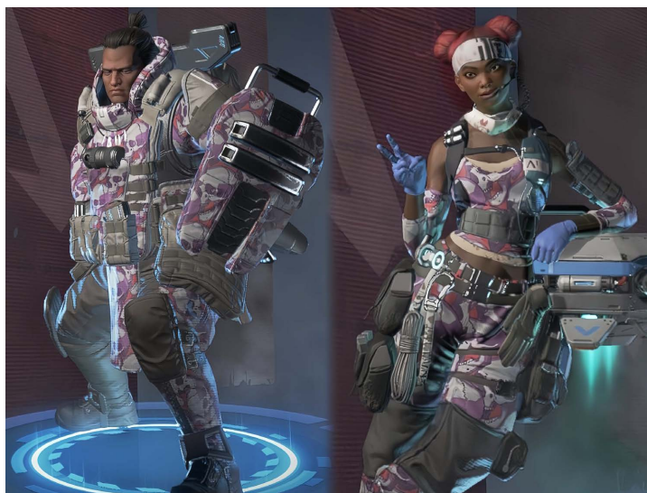
Figure 3. Game APEX clothing “Purgatory” 图 3. 游戏 APEX 服装《炼狱》 ③