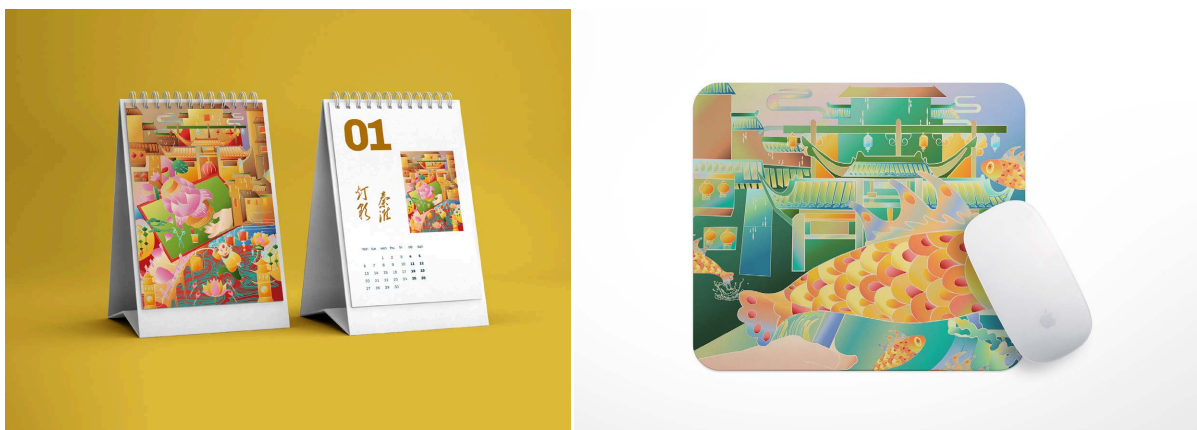
Figure 2. Qinhuai lantern cultural and creative design 图2. 秦淮灯彩文创设计