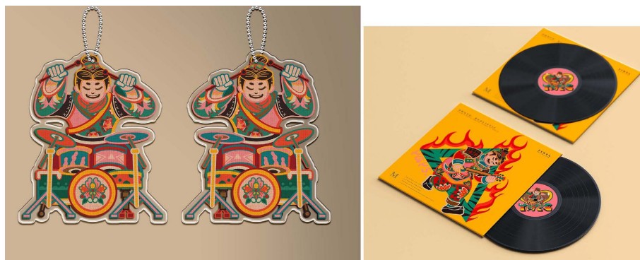
Figure 1. Cultural and creative application 图 1. 文创应用

介于文字和艺术之间的一种可视化的表达方式,它可以用纸质媒介和其它媒介进行大规模的复制和传播。它以特定的符号和表现形式来表达创意,把设计概念直观地呈现出来,从而使得设计形象具备某种传递资讯的能力。作为设计中与其它基础元素相结合的一种符号,它能满足各种应用场合的需要,具有较强的视觉氛围和较强的视觉表达能力,因此缩小了与观众之间的距离,加强了对应的文化渗透,使设计出的作品更为完美,更加巩固了文创产品。