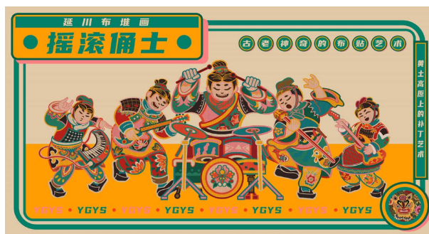
Figure 2. IP image design 图 2. IP 形象设计

陕北延川布堆画的独特之处在于他精彩纷呈、形式多样的创作题材,大多以民间生活、戏剧人物、花鸟传说等等为主,因此可以提取其中相关的纹样与现代元素相结合。譬如可以从布堆画《胖娃娃》、《鱼戏莲》、《小老虎》、《蛇盘兔》等作品中提取表达祈求神仙庇佑、渴望美好生活、尊崇生命繁衍的思想意志的纹样,运用到设计中,极具独特美感(见图 2)。亦或是将提炼出来的图形打散重组,将其几何化进行创意设计,也别有一番风味(见图 3)。