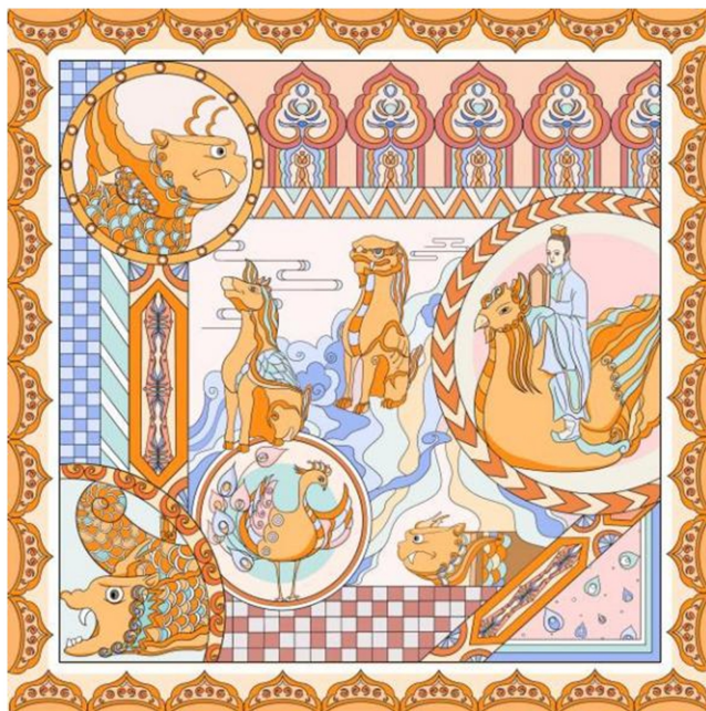
Figure 1. Yellow color scheme 图 1. 黄色系配色方案

色彩一直是设计中需要着重考虑的一点, 优秀的配色方案能迅速得到观众的注意。根据建筑等级和用途的不同, 屋脊上脊兽的颜色呈现出多种变化, 同时考虑到现代人对于色彩的喜爱各不相同, 因此在进行配色时, 采用了四种方案, 分别是以黄色系和粉色系为主的暖色调(如图 1)、以蓝色系和绿色系为主的冷色调。在其中除了同色系色彩的运用之外, 还加入了大量对比色的运用, 目的是为了产生一定的视觉冲击力, 快速吸引观众的注意力。