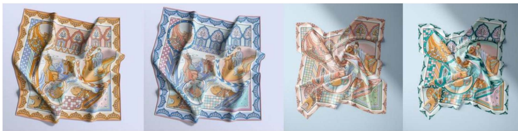
Figure 2. Display of scarf effect picture