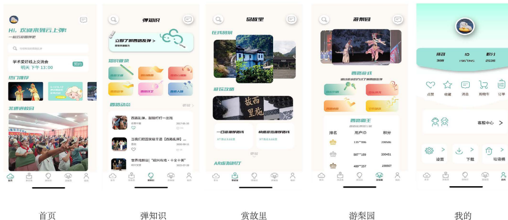
Figure 3. UI main interface display 图 3. UI 主界面展示