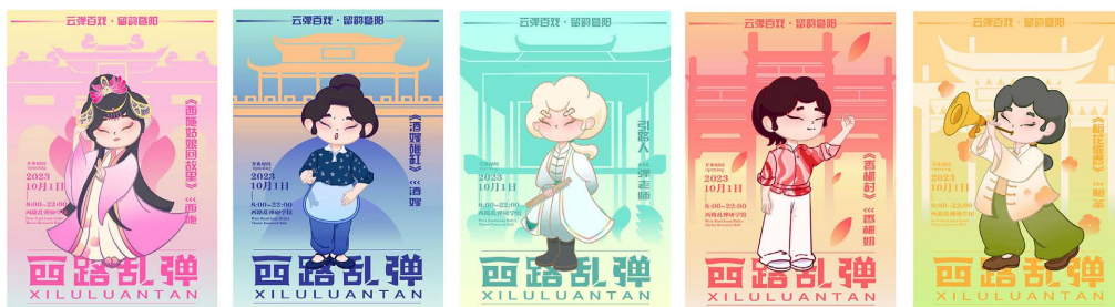
Figure 4. Schematic diagram of offline event poster design 图 4. 线下活动海报设计示意图

通过文创衍生品的设计，将西路乱弹的视觉设计与社会需求相结合，从而拓宽文化传播渠道，例如进行西路乱弹主题的文创设计，线下宣传活动的海报设计等。笔者以 IP 形象为主题，与其他元素进行整合，制作线下西路乱弹研学馆文化宣传活动的海报设计(如图 4)，还有 IP 盲盒文创设计、帆布袋等生活用品设计，它们都将通过“线下 + 线上”双模式进行销售来拓宽西路乱弹宣传力度。