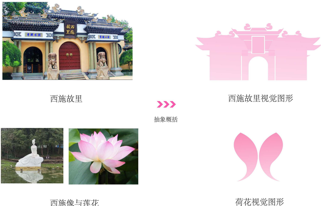
Figure 2. Schematic diagram of element refinement and reconstruction 图 2. 元素提炼重构示意图

化与现代融合的颜色再合适不过。同时根据色彩搭配法则，将米棕色浅化，与青绿色相适应。在选定辅助色过程中，从剧目的主人公中寻求灵感，分别由寓意着柔美的粉色反映西施的性格，勇敢的蓝色反映酒嫂的性格，欢快的橙色反映梅圣的性格。最终以主体色为基础，辅助色进行点缀，形成一整个绚丽、引人瞩目的西路乱弹色彩体系，赋予西路乱弹新的活力与生命。