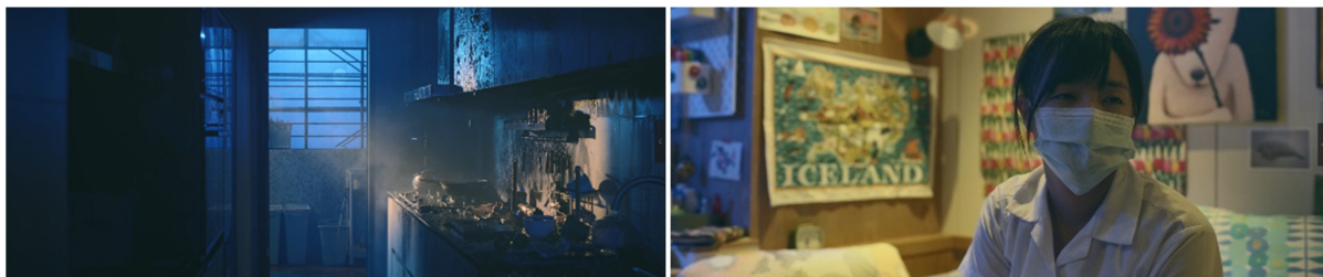
Figure 3. The home after the fire (left) and the home after electricity was supplied in The Falls (right)

导演用蓝色影调和光影丰富了人物的形象, 表达了人物的心理状态。在罗品文幻想有人拿走了家里的黄金与存折而翻遍衣帽间, 与女儿发生了激烈的争吵。室内透着蓝色的光线, 导演也用俯拍镜头展现了一墙之隔的两个空间内, 母女二人的状态, 罗品文悲愤、哀怨地哭泣, 而小静则听着母亲的哭声, 独坐在床上, 怀抱玩偶害怕、无助而颤抖着无声哭泣起来。两种哭声、两个空间形成了鲜明对比, 将人物当下的情绪及心理生动地描绘了出来, 罗品文想保护女儿却因病情的反复无法自控, 是自责和迷茫, 小静面对家中的巨变和母亲的疾病感到无助、恐惧。而母女二人争吵过后, 导演用蓝色影调描绘了罗品文的梦境, 暗喻着人物当下所处的真实情境。她梦见一栋没有任何人往来, 也没有安全护栏的大楼, 一个刚学会走路的小孩往没有护栏的阳台走去, 小孩的妈妈害怕小孩摔下楼, 冲向小孩想拉住他, 结果自己冲太快刹不住摔下楼。这场意象鲜明的梦境, 深蓝色的画面中透露着阴森、惊悚的氛围。现实中, 罗品文因病情难以自控, 而梦境中母亲冲向孩子的保护欲也暗指着她的母爱本能, 体现了罗品文的无助与彷徨, 这一梦境正是罗品文内心及母女二人关系处境的体现。如图 3 所示, 在家里遭遇失火后, 小静迎着邻居的指责声脚步沉重地走进笼罩在蓝色之下的家, 她望着一片狼藉的屋内, 眼神中充满着无助。本该是无忧无虑上中学的年纪, 却因为家中接连不断的变故, 不得不比其他人早熟、懂事起来, 开始照顾家中生病的母亲及处理债务。正当小静一个人敞着家门抱着玩偶在房间内睡着了, 曾经在家中工作过十余年的阿姨及时出现, 阿姨无私的帮助和关心给了小静温暖, 此时家里的电也通了, 房间内不再是忧郁的蓝色, 暖黄色的灯光也带给人一丝温暖, 观众也为之动情。在阿姨没有出现之前, 十八岁的小静还不知如何面对满屋的狼藉, 不知如何解决晚饭, 此时她是无助的, 阿姨的出现带给了她温暖、依靠和力量。