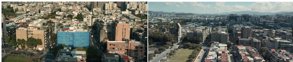
Figure 1. The blue construction fence outside the building (left) and the building after removing the fence in The Falls (right)

色彩运用于人类社会时,受文化环境和历史背景的影响,产生了文化意义,具有象征性,内涵也更加丰富。钟孟宏导演选取蓝色为视觉元素及影调,蓝色的客观物体参与电影叙事,反映电影主题,具有象征意义;蓝色的光影和影调则起到塑造人物形象、渲染意境氛围的作用,三者结合丰富了影片视觉呈现,深化了影片主旨。在《瀑布》中,面对疫情期间严峻的疫情形势、冰冷的家庭氛围、受挫的职场及破碎的夫妻感情,多重压力之下的罗品文出现了心理问题,母女二人的生活发生了巨大的变化。蓝色在影片中作为客观物体存在,一是医用口罩的颜色,象征着新冠疫情本身[6],代表着新冠疫情生活中人们被隔离、压抑、疏远,有一种强烈的距离感。在电影中,即使在家中母女二人也戴着口罩,保持距离,此时不仅是物理空间上的距离加大了,人与人之间心理上的距离也在加大。二是母女二人住所外因外墙施工而悬挂的蓝色防水布,影片中多次出现大楼的航拍全景镜头,围着蓝色防水布的大楼也好似与其他楼栋隔离,显得孤立、距离感。蓝色防水布也遮住了窗外的景色和阳光,将空间封闭起来,象征着被困的人们及孤独、疏离的人物心理。如图1所示,大楼的蓝色防水布又像是一个巨大的口罩,将人与人之间隔离,代表着正在经历疫情的每一个人。不论是面部的口罩还是大楼外的“口罩”,都是人与人之间物理空间和心理距离疏远的象征。随着大楼外墙施工的完结,蓝色防水布缓缓落下,久违的阳光才照射入室内,笼罩着客厅的蓝色才消失不见。蓝色的消失之时,也正好是罗品文病愈后开启新生之际。导演用色彩的变化反映了人物命运的变化,推动着剧情不断发展,观众对于电影主旨的理解也更加深刻。