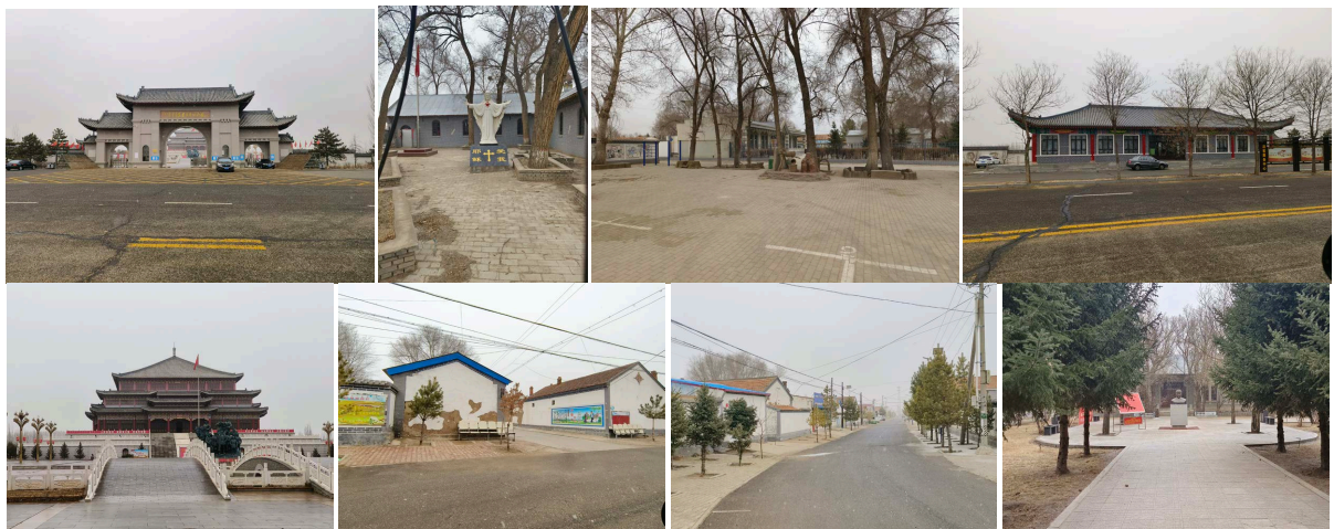
Figure 2. Village landscape map 图 2. 村庄风貌图

村落经过长期的发展, 承载了悠久的乡土文化以及当地的民族风情, 但由于受到各方面因素的影响, 在当下井沟村的发展中, 文化的保护与发展尚有一定的关注, 但是挖掘力度远远不够, 导致其文化功能体现不佳, 文化的内在价值缺乏一定的宣传, 文化的吸引力度不足, 村庄旅游业的发展缓慢。