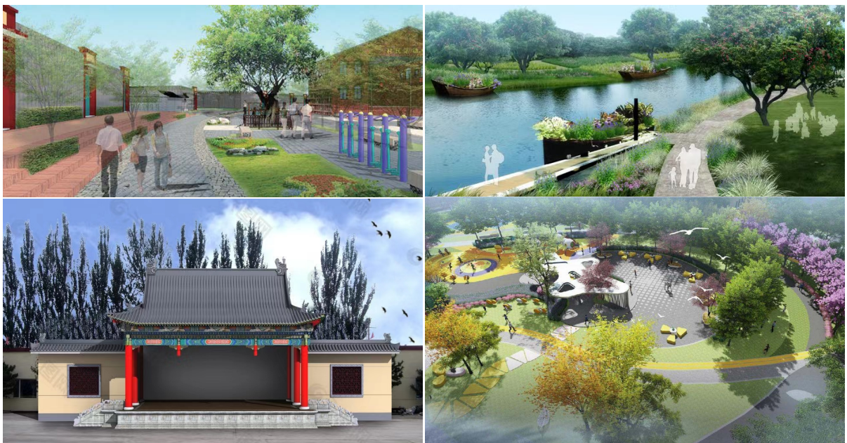
Figure 4. Schematic diagram of ancient trees, waterfront park, stage and square

井沟村村庄节点空间打造上充分考虑当地的特色, 为特色文化提供空间载体, 让特色文化与村庄有机结合。井沟村村口、古树、戏台、九岱沟沿岸作为村庄重要的组成部分, 规划将其作为文化承载的实体, 进行特色景观节点打造, 见图 4。