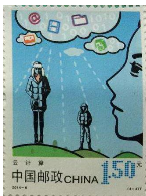
Figure 3. Pictograph of the nose in the stamp of cloud computing issued by China in 2014 图 3. 中国在 2014 年发行的云计算邮票中的鼻子形状

此外，字母 N 的本源是鼻子，它与汉字“鼻”的象形差距较大。在中国古代战国之前，采用“自”来代替“鼻”。从甲骨文来看，“自”取自人的正面象形。然而，字母 N 似乎是取自人的侧面象形，如图 3 所示。字母 N 的上下两个“开口”，似乎代表了“一呼一吸”。