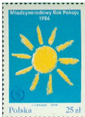
Figure 5. Stamp of children's painting sun for international peace year issued by poland in 1986 图 5. 波兰在 1986 年发行的国际和平年儿童画太阳邮票

字母 R 的本源是火，代表的是宇宙，字母的形状与太阳的形状相似(图 5)。因此，与火和太阳有关的词语通常会使用字母 R，例如，red(红色)、rare(稀有的)、ray(射线)等单词。根据火和太阳的光线，衍生出了发射等含义，例如，rank(排)、radar(雷达)、rain(雨)等。还有些是借用了 R 的形状，例如 root(树根)的形状像字母 R，rabbit(兔子)的洞穴像字母 R，run(跑步)时屁股和腿的组合像字母 R。