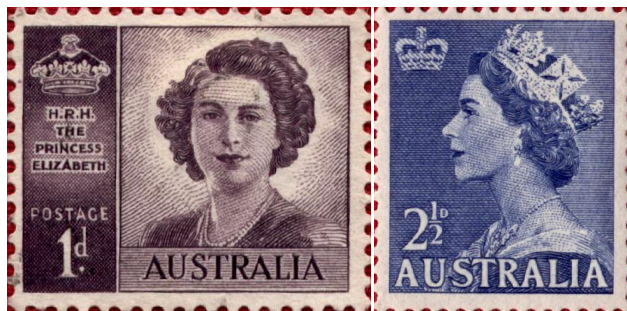
Figure 2. Stamps of Elizabeth's front photo (1947) and side photo (1953) issued by Australia 图 2. 澳大利亚发行的伊丽莎白正面照(1947 年)和侧面照(1953 年)邮票

另外，在汉字中，形容人和动物的四肢末端，分别使用了“手”、“脚”和“爪”等汉字。从外形上看，字母 M 与汉字“爪”相似，本源是可以理解为是“手”。类似的情况还有字母 E，字母 E 与汉字“目”的小篆字体相似，同时还与汉字“耳”的甲骨文、金文和小篆字体相似。在此，我们可以认为字母 E 的本源是眼睛和耳朵。如图 2 所示，字母 E 在“目”的角度来看，好像是眉毛、上眼睑和下眼睑的组合。例如单词 eye(眼睛)可以看做是 E(目)+Y(Y 字形)+E(目)的象形组合。在“耳”的角度来看，字母 E 与甲骨文“耳”的外形相似(图 1)。