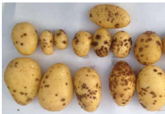
Figure 1. Infected tuber with lesions

块茎染病初在表皮上现针头大的褐色小斑, 外围有半透明的晕环, 后小斑逐渐隆起、膨大, 成为直径 3~5 mm 不等的“疱斑”(图 1), 其表皮尚未破裂, 为粉痂的“封闭疱”阶段[3]。后随病情的发展, “疱斑”表皮破裂、反卷, 皮下组织现桔红色, 散出大量深褐色粉状物(孢子囊球), “疱斑”下陷呈火山口状, 外围有木栓质晕环, 为粉痂的“开放疱”阶段。感病的根系和匍匐茎产生很多根瘿(直径达 3 毫米), 这些小球起初是白色的(图 2), 但是接着成熟变成棕褐色[4]。