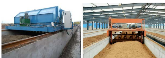
(b) 发酵槽式堆肥发酵工艺