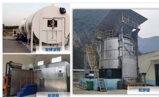
(c) 反应器式堆肥发酵工艺