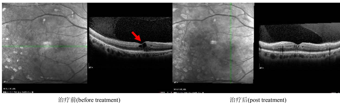
Figure 1. Therapeutic effect of photocoagulation on pre-proliferative diabetic retinopathy (PPDR) shown by optical coherence tomography (OCT). The results show the reduced retinal edema after being treated with pan-photocoagulation (arrow points the retinal edema)

图 1. 增殖前期患者激光光凝治疗前后 OCT 变化：治疗前视网膜水肿明显，视网膜增厚(左图，箭头指视网膜水肿)；光凝治疗后视网膜水肿明显减轻，厚度减少(右图)