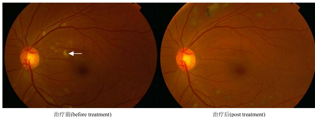
Figure 2. Therapeutic effect of photocoagulation on pre-proliferative diabetic retinopathy (PPDR) shown by ophthalmoscopy. The ophthalmoscopic view shows the reduced cotton wool spots after being treated with pan-photocoagulation. Arrow points the cotton wool spots

图 1. 增殖前期患者激光光凝治疗前后 OCT 变化：治疗前视网膜水肿明显，视网膜增厚(左图，箭头指视网膜水肿)；光凝治疗后视网膜水肿明显减轻，厚度减少(右图)