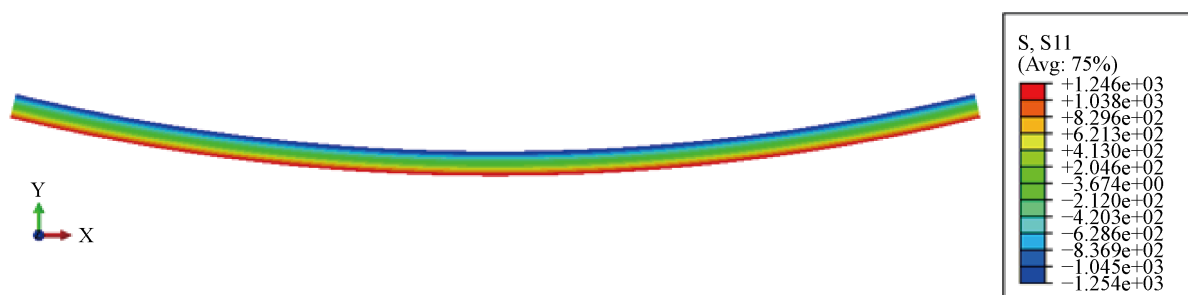
(a) 梁轴向正应力计算结果

用数值方法也证实了小变形情况下没有横向挤压的结论，也就是说横向应力有限元计算结果是零。那么大变形情况下结果如何呢？对大变形条件下的轴向及横向应力进行有限元分析的结果如图 1 所示。由于大变形情况下梁两侧加载方向没随截面转动而发生转动，导致存在边界效应，其影响区域的横向最大应力约为纵向最大应力的 5%。去除边界效应影响区域，中间区域基本没有横向挤压。显然，即使在大变形情况下，横向应力也极小，不应是纤维变形的主要因素。