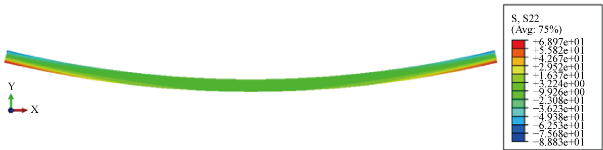
(b) 梁横向挤压应力计算结果