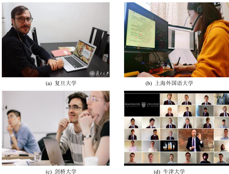
Figure 2. Participants used in the online teaching report by domestic and foreign universities 图 2. 国内、外高校新冠报道网络授课报道配图中人物参与图

图 2(a)和图 2(b)分别为疫情期间, 复旦大学和上海外国语大学线上授课报道配图, 均以“教师”为叙事主体, 可见国内报道宣传高度重视疫情期间教师团队为线上授课的付出, 突出教师在教学活动的主导地位。但图 2(a)中外籍教师的目光矢量射向观众, 形成与读者的互动, 而另一只手为矢量, 射向电脑键盘, 使观看者邀请到高校教师“停课不停教”的故事中去。图 2(b)女教师的目光直接射向电脑屏幕, 观众以旁观者的姿态了解高校教师如何积极承担远程教学任务的。