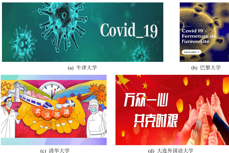
Figure 8. Visual images combining pictures and texts in the reports of Covid-19 by domestic and foreign universities