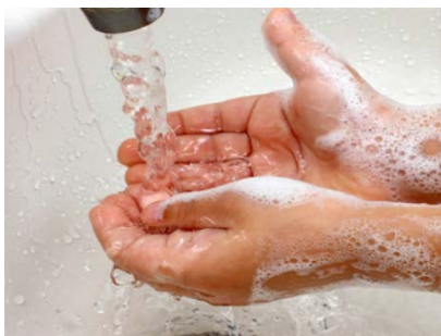
(a) 加州大学伯克利分校