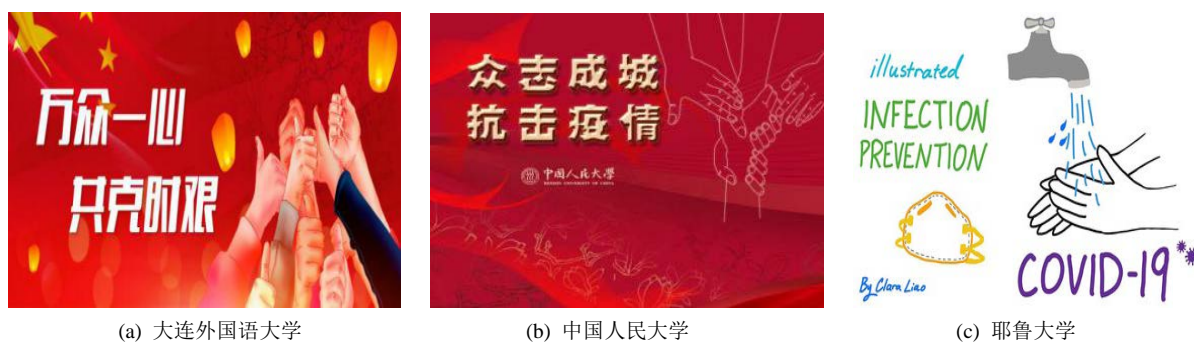
Figure 1. The symbolic representations of hand used in domestic and foreign reports 图 1. 国内、外报道配图中手部特征表征形式例图

国内高校新闻报道中“手”的配图(见图 1(a), 图 1(b))都以多人手部图像呈现, 转喻表征具有群体性, 即表征“帮助、支持”的概念意义, 又传达抗疫行动“万众一心”的凝聚力; 国外高校“手”部视觉图像多为单一表征, 伴随“水龙头”、“洗手液”等参与者, 构建出洗手的动作过程(见图 1(c)), 传递出“勤洗手是阻断疫情传播的有效途径”的概念与文本语言交相呼应, 构成交互模态。