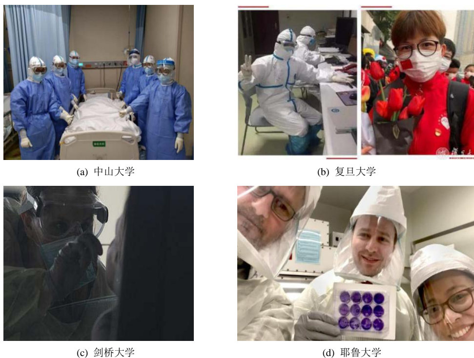
Figure 4. Vision projection of domestic medical staffs in reports by domestic and foreign universities 图 4. 国内、外高校配图中医护人员目光投射方向图

依据观众视角是否与图像参与者视角重合, 图像又分有中介与无中介两种(Painter et al. 2013) [12]。前者指读者视角不同于图中人物视角; 后者可细分为直示主观视角, 即读者视角跟随图中一位人物视角观察另一位人物的反应; 和引发主观视角即读者视角跟图中人物视角不一致, 但可以推断出图中人物面对的角色视角。中山大学 6 名医护人员的手作为矢量, 指向病床或患者, 使他们引发主观视角的表征明确, 视觉上将读者带到了医生护理工作中去, 起到了医者仁心、爱岗敬业的叙事作用。同样, 图 4(b) (左) 的医护人员的左手为矢量射向电脑, 邀请读者进入医护科研人员新冠疫苗研发的故事中去。