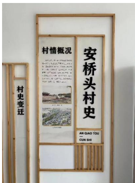
Figure 3. The history of Anqiaotou Village 图3. 安桥头村史

每个村庄的村史都是独一无二的，安桥头村建立了自己的村史馆(见图3)，其村史内容主要包括村情概况、村史变迁、鲁迅外婆家、民情风俗等。村史馆的建立，可以让当地村民和外来游客更好地了解本村历史，达到村史文化传播的目的。鲁迅外婆家这一特色是安桥头村的重要文化资源。根据这一特色该村庄利用幕布，电子显示屏，动画展板等动静结合的形式，生动全面的向游客展示鲁迅儿时在外婆家的生活状态，以此更加深刻的了解安桥头村的特色所在。该村史馆，在对村史介绍方面，内容较为完整多样，但是在语言使用方面有些缺失。调研发现，在对村史的描述中，只使用了汉语一种语言，并没有外语翻译或体现方言特色，没有构建多样化的语言环境，公共语言服务体系并不完善。这对外国游客了解村庄文化造成了不便，不利于吸引外来游客。