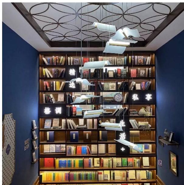
Figure 2. Bookcase 图 2. 书柜