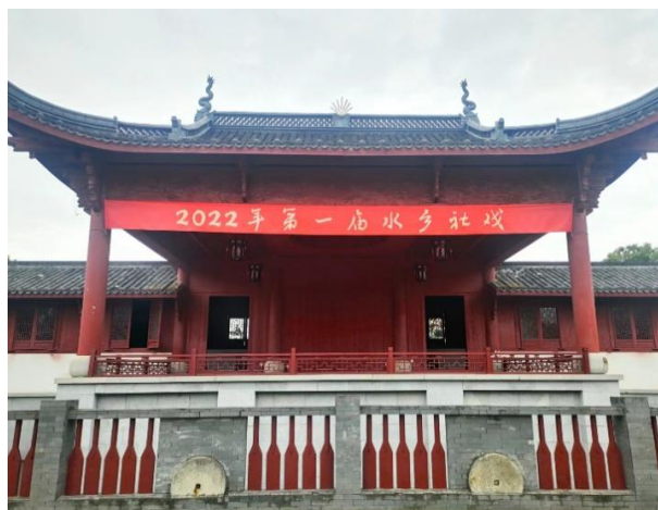
Figure 5. The theatrical performance in the water town 图 5. 水乡社戏

语言文化包括其他相关非物质文化遗产, 例如传统戏曲、地方文化、民俗仪式等[4]。安桥头村的祝福广场, 由鲁迅先生的作品《祝福》得名, 在该作品中提到了不少绍兴的民俗文化, 最具代表性的就是祝福祭祀礼。“祝福”被列入第二批浙江省级非物质文化遗产名录, “祝福祭祀礼”入选浙江省重点安排的二十四节气农耕文化活动。这一非物质文化遗产, 给安桥头村带去了特有的风俗文化, 该村庄对这一文化资源进行了发展传播, 举办了首届“鲁迅外婆家”祝福文化节。文化节的举办, 传承了当地的民