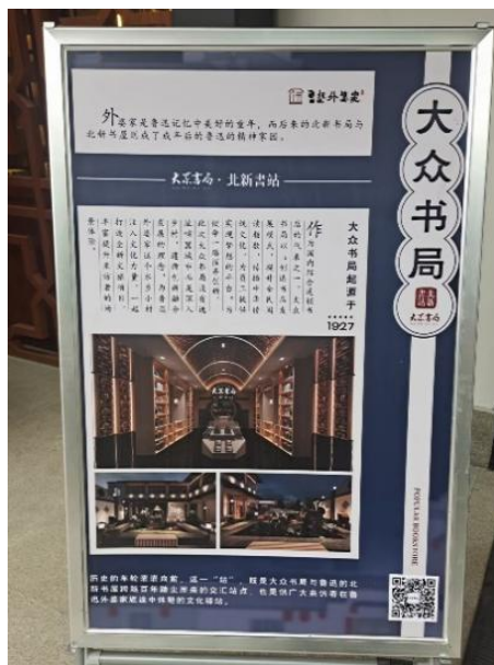
Figure 4. Dazhong bookstore 图 4. 大众书局

素质, 加强乡村道德文明建设的作用。该图书馆在传承文学文化的同时, 还存在一些问题, 该村村民文化程度不高, 过于高档的图书馆与当地村民真正需求不符, 在一定程度上, 不能很好地发挥图书馆的文化传播作用。