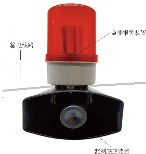
Figure 3. Effect drawing of online monitoring equipment 图 3. 在线监测设备效果图

根据上述分析,可确定在线监测设备的主要功能,简化在线监测设备的结构,使其更具有稳定性。并将在线监测设备和预警设备进行功能合并,在发现有危险的情况下发出报警,最终消除冲突得到最优的设计方案。成品图如图 3 所示。