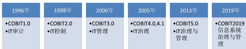
Figure 1. Evolution course of COBIT 图 1. COBIT 的演进

需求与技术问题结合起来,以探讨信息系统治理与管理的价值;第四,为了促进对信息系统进行更恰当地控制与评价,更新了成熟度模型的级别以及流程的具体描述[6]。