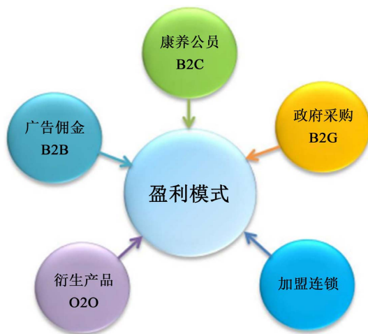
Figure 3. Sojourn-type cultural tourism and health care profit model 图 3. 旅居型文旅康养盈利模式

“旅居文旅康养”的商业模式，是一种“享老”“智老”的商业模式，它通过“严选”机制，整合社会旅居养老资源，开发各类老年培训课程，为全国各地的老年游客提供旅居产品，如图 3 所示。