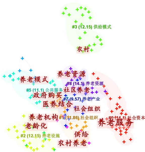
Figure 2. Keyword analysis 图 2. 关键词分析

由图 2 可知,Modularity Q = 0.7971 , Q 值大于 0.3,可见聚类的效果是较好的。 N (节点数) = 270, E (连线数) = 365, density (密度) = 0.0101。自 1998 年起至 2022 年,有关养老服务供给的关键词主要有养老服务、养老模式、养老资源、政府购买、社区养老、医养结合、社会组织、养老机构、农村养老等。