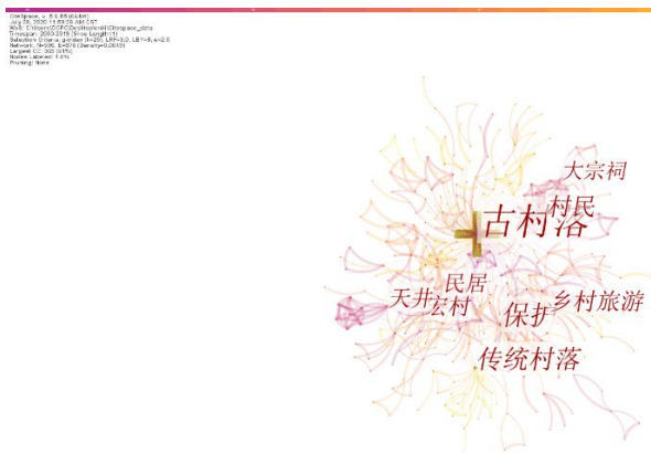
Figure 1. Key words relationship diagram of ancient villages on CNKI from 2000 to 2019

CiteSpace 是一种知识可视化软件，它融合了聚类分析、社会网络分析、多维尺度分析等方法，定量可视的梳理文献，通过绘制知识图谱，将某领域一定时期的研究现状和主题演化展现在图谱上。笔者以“古村落+”的关键词搜索形式，在 CNKI 数据库(中国期刊网)搜索自 2000 年至 2019 年，将与“古村落”相关联的关键词可视化于一张图谱中(见图 1)。