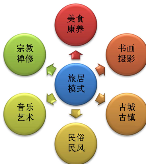
Figure 1. Sojourn and health mode 图 1. 旅居康养模式

以中医养生为核心，遍访地方特色养生膳食、素斋、绿色餐饮、养生茶汤、养生保健食品等多种食疗养生产品于一体的美食享老体系。并设置身体健康检查、医疗器械监测、健康咨询管理等多种享老服务项目。