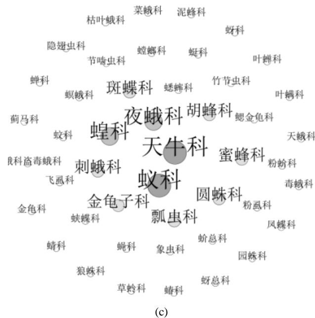
Figure 3. Overview of plants, animals and insects species at the Chenggong Campus of Yunnan University. (a) Plants; (b) Animals; (c) Insects