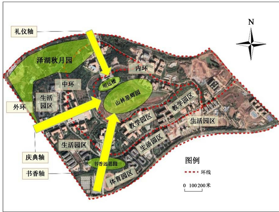
Figure 2. Spatial structure layout of the Chenggong Campus of Yunnan University 图 2. 云南大学呈贡校区的空间结构布局

“三区”为教学园区、生活园区、体育园区。三个区域集教学科研、师生生活于一体, 各功能区相互融合, 互不独立。整体规划遵循自然和谐的原则, 为师生的学习生活营造出良好的环境。