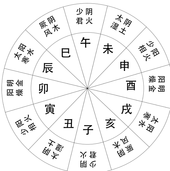
Figure 2. Diagram of the twelve terrestrial branches transformed into six climatic factors