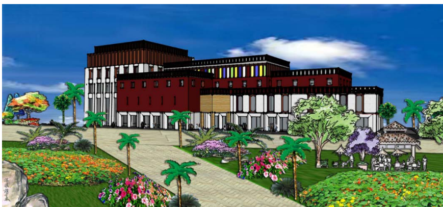
Figure 4. Partial renderings of the planning and design of Xiangbala Ancient Town 图 4. 香巴拉古镇规划设计局部效果图

主要位于地块的西部地区，是整个地块占地面积最大的区域，房屋朝向以南北朝向和东西朝向混合，里面布置有休憩、藏染、藏服饰、藏语言、藏建筑等景观和藏文化特色(局部效果图见图 4)。