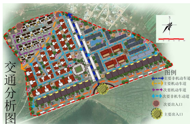
Figure 5. Traffic analysis diagram for planning and design of Xiangbala Ancient Town

香巴拉古镇道路按等级和功能的不同主要分为以下四种：主要机动车大道、次要机动车道、主要非机动车道、次要非机动车道(图 5)。在车行系统方面，古镇主要机动车道设置宽度为 16 m，其作用为使古镇对外交通和景区内部交通紧密连接；次要机动车道主要设置在民宿区，宽度为 6 m，主要为单行道，作用为旅客提供便利的交通，方便旅客行李的运输。在人行系统方面，为了使游客能够更好的观赏古镇风貌，体验藏族文化风情，古镇主要人行道设置在主街区，为一条南北联通的道路，主要宽度为 12 m，道路两旁摆放绿植作为景观点缀；次要人行道的功能为连接各个片区，实现古镇交通流线的畅通，其主要宽度为 5 m。古镇共设有四个出入口，主要出入口在古镇南侧，其余三个出入口分别分布在古镇北侧、西侧和东北侧。