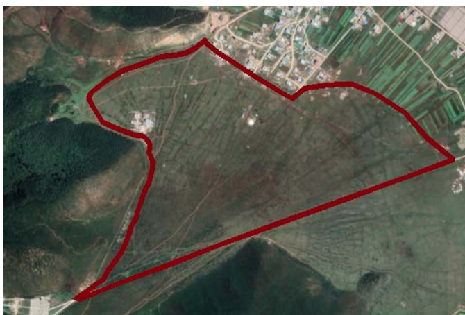
Figure 1. Current situation of the planned land plot 图 1. 规划地现状图

规划地位于石卡路北部的开阔地区,地势平坦,视野开阔,位于蓝月山谷西部(图 1)。