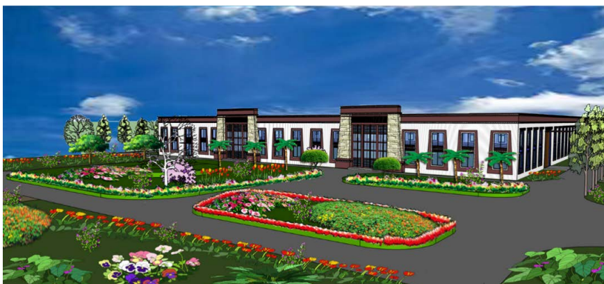
Figure 3. Partial renderings of planning and design of Xiangbala Ancient Town 图 3. 香巴拉古镇规划设计局部效果图

民宿区位于整个地块的西北方向，主要由六组团和一风景区组成。每个组团配备单独的停车场，方便游客停车休憩。房屋整体朝向基本上是坐北朝南，道路主要采用“三横一纵一斜”的布局形式。民宿景观区在民宿社区中间，形成以水景为主题的一处景观区域(局部效果图见图 3)。