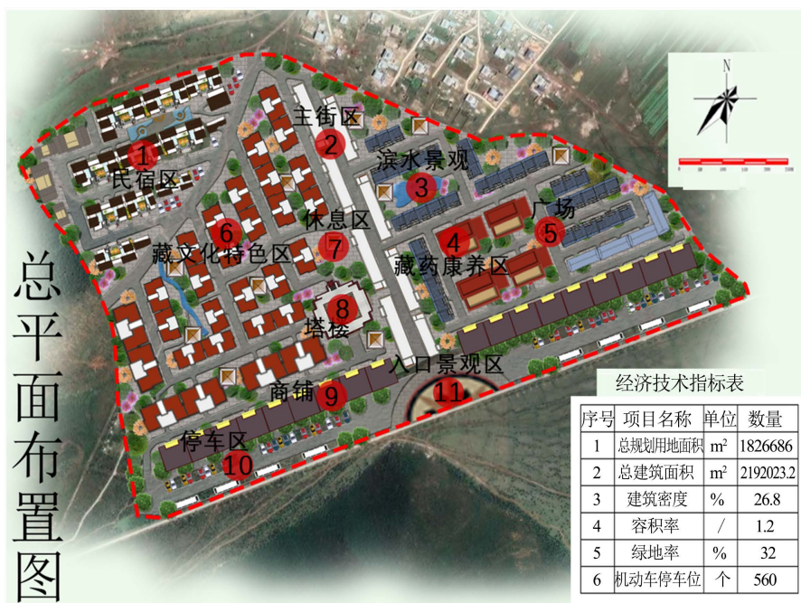
Figure 2. General layout plan for planning and design of Xiangbala Ancient Town 图 2. 香巴拉古镇规划设计总平面布置图

本次香巴拉古镇规划设计，整个片区采用“一商一街一住二藏七片区”的布局形式(图 2)。一商：东西商业街。一街：中部主大街区。一住：民宿居住区。二藏：藏药药浴区、藏文化体验区。七片区：民宿区、藏文化特色区、商业区、停车区、滨水景观区、藏药康养区、主要街道区。整个香巴拉古镇规划设计项目总建筑面积 1,826,686 平方米，容积率 1.2，建筑密度为 26.8%，绿地率为 32% (表 1)。