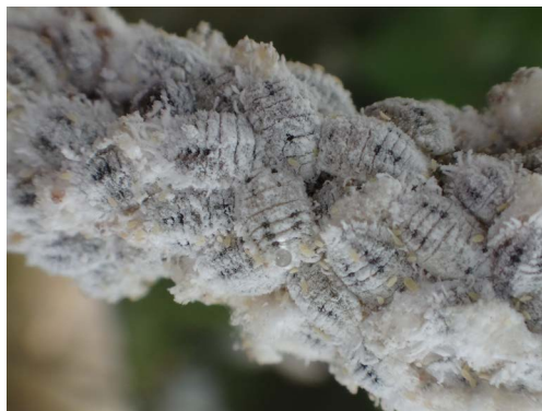
Figure 1. Female adults 图 1. 雌成虫

野外调查和室内饲养共发现 3 种扶桑绵粉蚧天敌，即班氏跳小蜂( Aenasius bambawalei )，寄生若虫和成虫形成黄褐色的僵蚧(见图 3)，寄生率可达 39.5% 左右，抑制作用较大；六斑月瓢虫( Cheilomenes sex-maculata ) (见图 4)和异色瓢虫( Harmonia axyridis )，成虫和幼虫捕食扶桑绵粉蚧各虫态。