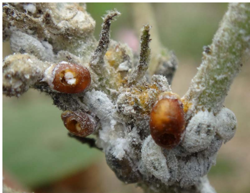
Figure 3. A. bambawalei parasitic stiff scales 图 3. 班氏跳小蜂寄生的僵蚧