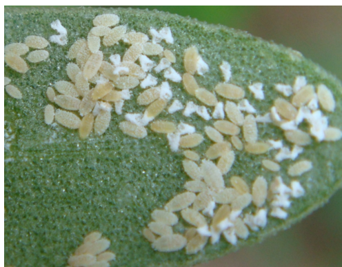
Figure 2. Nymphs 图 2. 若虫