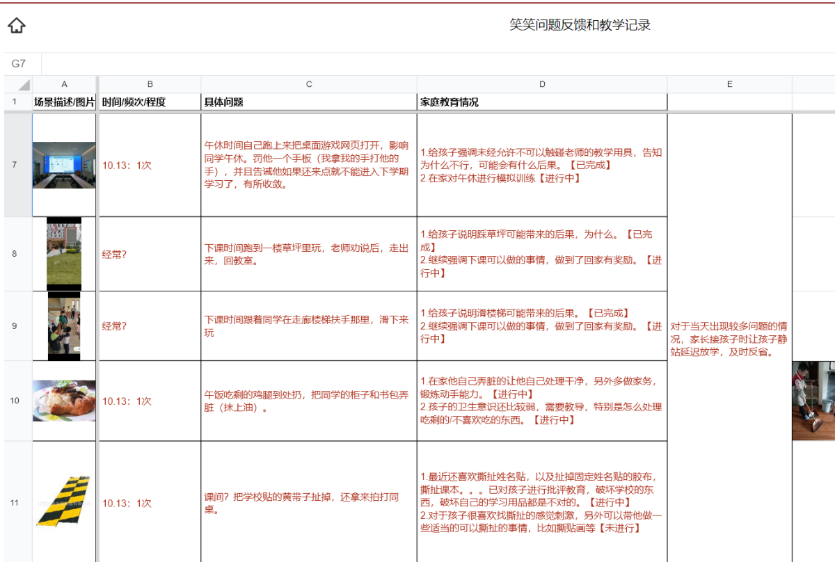
Figure 3. Partial display of Xiaoxiao's problem feedback and teaching records