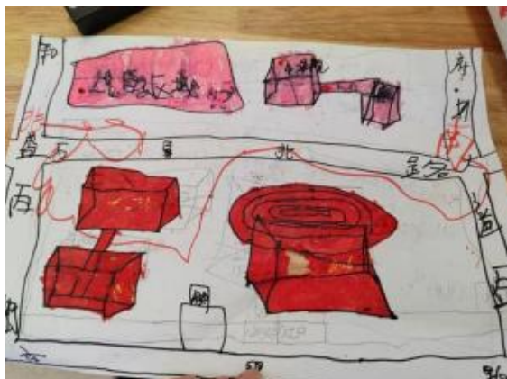
Figure 1. Xiaoxiao gave the campus map to the writer 图 1. 笑笑送给笔者的校园地图