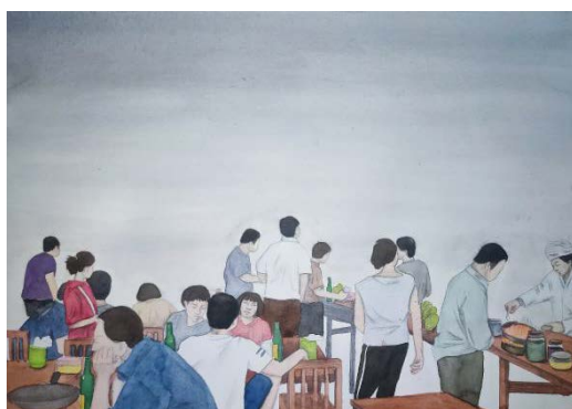
Figure 3. Street food vendor 图 3. 大排档 ®

创作思想上不谋而合，两者都将其作品内涵表现得淋漓尽致，画面中的隐喻，艺术语言传达思想，都能让我们不断发掘作品的内涵，每次观赏都有与众不同的感受。