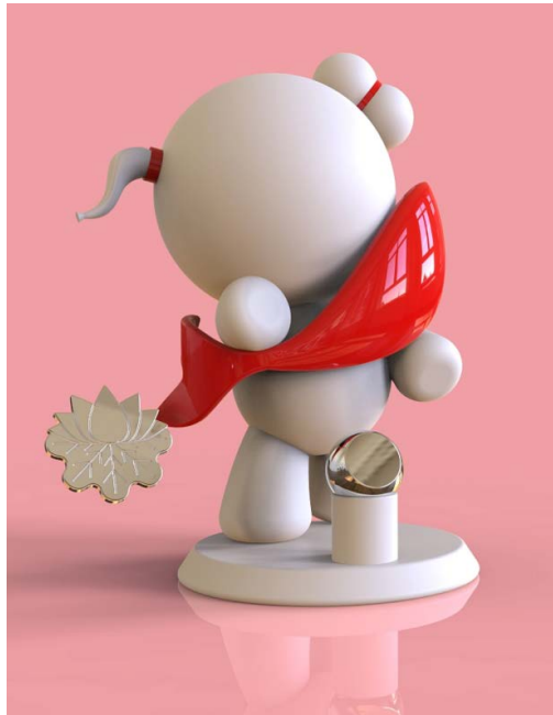
Figure 9. New Year's paintings doll series I 图 9. 年画娃娃系列一®