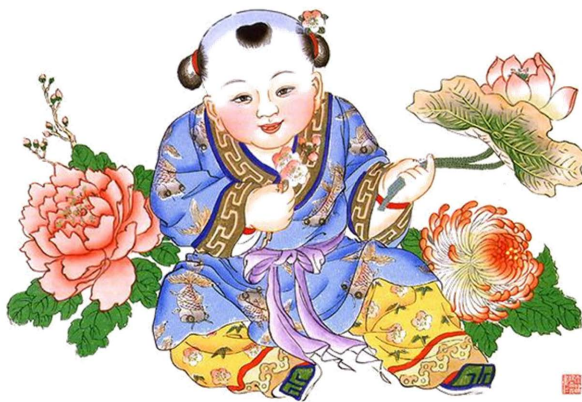
Figure 2. Yangliuqing New Year's paintings 图 2. 杨柳青年画 ②

以杨柳青年画为例(如图 2), 杨柳青年画以写意手法凸显人物特征, 融入画师主观意愿, 进行趣味性创造。在形象处理上, 大胆取舍、夸张、变形, 使形象圆润丰韵、神态欢欣, 营造轻松灵动的画面效果 [2]。苏州桃花坞年画线条细腻且流畅, 画面立体感显著, 整体对比强烈, 色块分明, 具有强烈的装饰性, 展现了中国当时发展阶段较高的艺术水平(如图 3)。相比之下, 杨家埠年画为了加强画面的视觉冲击效果, 突出主体形象, 经常采用高度概括和夸张的艺术手法。特别是在处理人物形象时, 通过夸张头部特征, 使得整个造型既富有生活气息又生动活泼, 主题表达明确而有力 [3]。