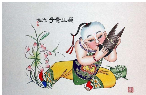
Figure 4. Lotus seed gives birth to noble son 图4. 《莲生贵子》 ④

面构成为主导, 不过多追求纵深空间的层次感。画面中的艺术形象通常被平展展开, 各自占据其应有位置, 互不干扰或遮挡, 从而呈现出一种独特的视觉效果。