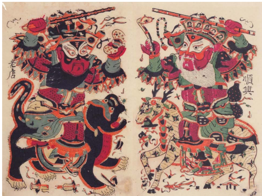
Figure 6. Portrait of the majestic door god 图6. 威严门神形象®

儿童接受度是将木版年画元素应用于儿童文创设计时面临的重要问题之一。尽管木版年画具有丰富的文化内涵和艺术魅力, 但其传统性和复杂性可能会影响儿童对其的接受度。木版年画蕴含着丰富的中国传统文化内涵, 如民俗风情、历史故事等, 这些元素可能与儿童所处的文化背景和生活经验存在差异, 导致理解障碍和认知困难。儿童可能无法理解画面中所表达的文化意义, 从而影响他们对作品的接受度和情感投入。有些木版年画作品的主题和情节甚至过于严肃或抽象, 比如杨家埠年画中的门神形象(如图6), 与儿童的日常生活和兴趣不符, 缺乏与儿童生活相关的情节和元素。这使得儿童难以产生共鸣和情感连接, 降低了他们对作品的兴趣和接受度。