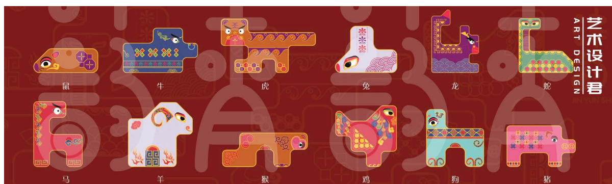
Figure 8. Magnetic block puzzles 图 8. 磁性积木拼图 ⑦