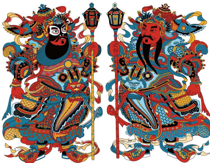
Figure 1. Yangjiabu New Year's paintings 图 1. 杨家埠年画门神形象 ①