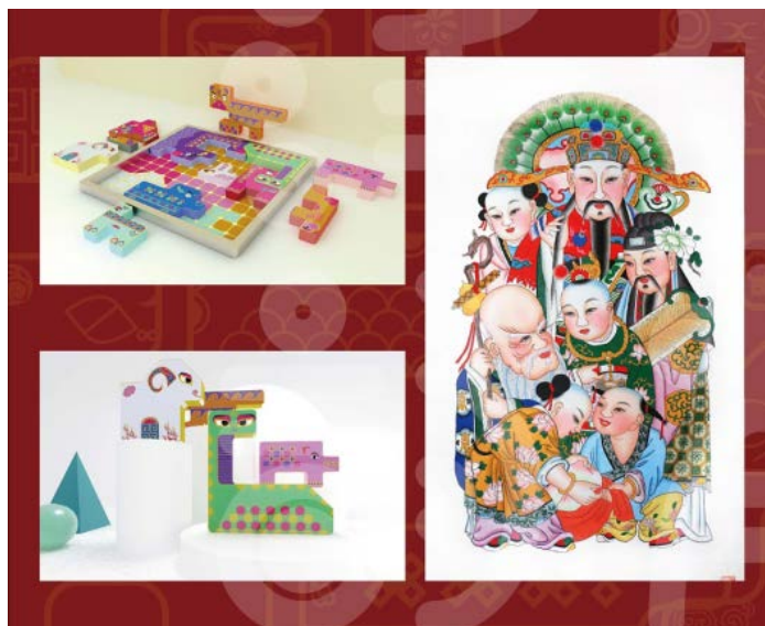
Figure 7. Block design drawing 图 7. 积木设计图 ⑦

织中,产生了一种全新的碰撞。再者利用数字化和互联网技术,开发交互式的儿童文创应用,如手机应用、在线教育平台等。可以通过AR(增强现实)和VR(虚拟现实)技术,将木版年画元素与现实世界进行结合,为儿童提供沉浸式的学习体验,拓展他们的文化认知和想象力。