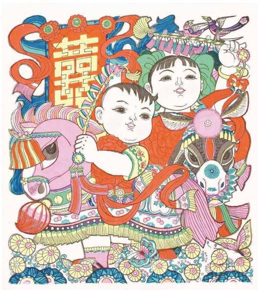
Figure 3. Suzhou Taohuawu New Year's paintings 图 3. 苏州桃花坞年画®

总体而言, 不同地区和流派的木版年画在人物形态上都有着各自独特的特点, 但均体现了中国传统文化丰富内涵和人们对美好生活的向往。这些年画通过对人物形态的塑造, 展现了中国人民对家庭、社会与宗教文化的精神寄托和情感表达。