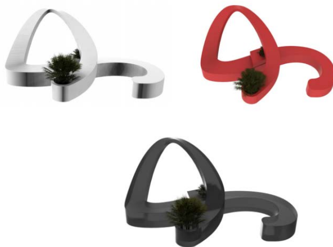
Figure 3. Ink color, jade white, Chinese red three color design

三个颜色运用到社区公共座椅中, 表达了中国文化元素中几个较为突显内涵的色彩, 色彩语言与非遗视角下草书形态运用到社区公共座椅中的非遗文化进社区的主题相关。简单颜色渲染图, 见图 3。