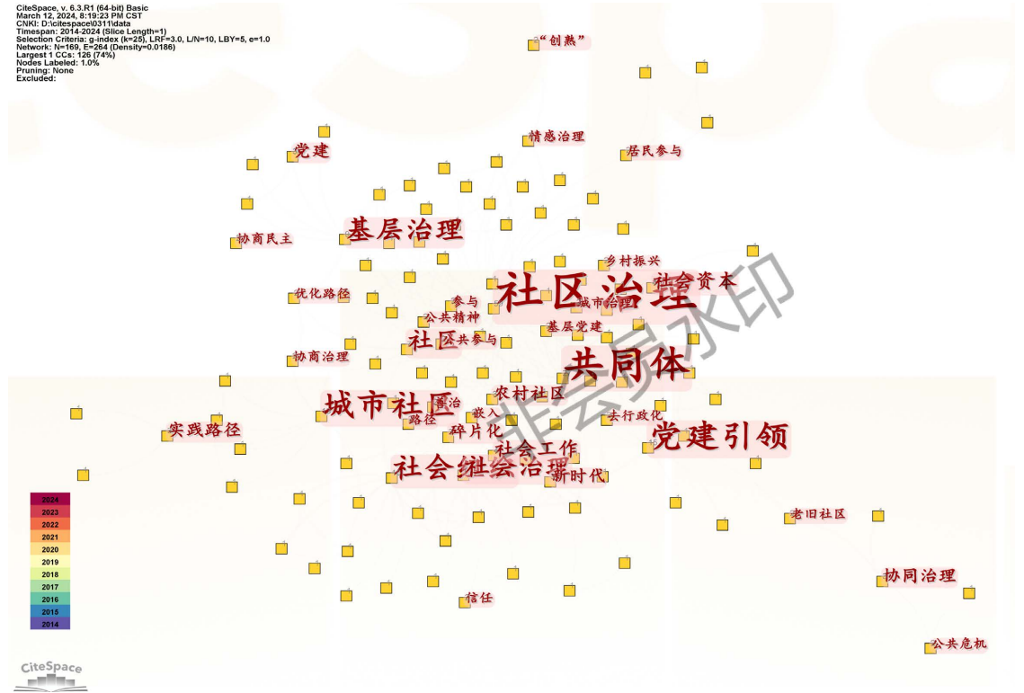
Figure 3. Keyword co-occurrence cluster analysis 图 3. 关键词共现聚类分析