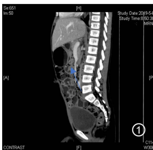
Figure 1. Heterotopic pancreas in CT

[2]。异位胰腺可见于任何年龄，但报道中儿童较罕见。其原因之一即为对异位胰腺的诊断仍缺乏有效的诊断方法。如在吴华哲[3]的报道中，7例异位胰腺患儿术前均行了B型超声、CT、MRI、消化道造影等检查，均无特异发现，而是于术中偶然地发现了异位的胰腺。并且，虽然异位胰腺于CT或MR可有如初级导管样的特征性的诊断特征，然而也是于少数病例中可见。该病例中异位胰腺即误诊为部分型环状胰腺；其二即为临床症状不典型或不明显。异位胰腺患者可无症状或可有呕吐、腹痛、黄疸、癌变等非特异性症状，极易隐藏于其他具有相似临床症状的疾病中，故常为术中偶然发现；最后，异位胰腺为一种先天疾病，出生后早期却极少出现临床症状，随着机体生长，病灶随之增大，此时则可能出现临床症状。在胃肠道中，异位胰腺主要位于黏膜下层(54%)、黏膜下层和肌层(23%)、固有肌层(8%)、浆膜下层(11%)，位于胃肠道全层的极为罕见(4%) [4]。该患儿异位胰腺部位即为较为罕见的浆膜下层。另外，异位胰腺为一种少见疾病，现并无标准的治疗方案。对于术中偶然发现的异位胰腺，为了避免远期并发症，均应予以切除；对于那些有临床症状的患者，手术切除也是有必要的[3] [5] [6]。