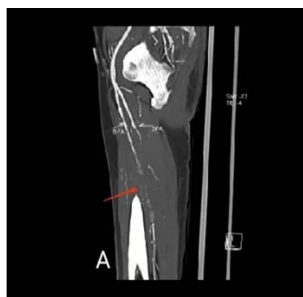
Figure 1. Severe diffuse arterial stenosis 图 1. 严重弥漫性动脉狭窄

抗凝，阿司匹林肠溶片抗血小板聚集治疗。2020.12.02 患者因右下肢疼痛加重再次入院，复查下肢动脉CTA提示：下肢动脉血管闭塞较前加重，右侧股动脉节段性完全闭塞，于2020.12.21转入血管外科行经皮下肢动脉取栓术(机械吸栓右) + 股动脉覆膜支架置入术 + 股动脉球囊扩张成形术，术后血管造影显示，重度弥漫性股动脉狭窄的长度明显减少，经血流量良好，见图2，但患者下肢疼痛无有效改善，继续行抗凝、抗血小板、止痛治疗。2021.07.31 患者因下肢疼痛加重且持续不缓解再次入我院治疗，查白细胞 12.1 \times 10^9/L ，血红蛋白 85 g/L，C反应蛋白 63 mg/L，磷 2.04 mmol/L，钙 1.94 mmol/L，肌酐 594.6 \mu\text{mol/L} ， \beta_2 微球蛋白 18.52 mg/L，甲状旁腺激素 59.170 pg/mL。心脏彩超检查提示：EF52%，室壁各节段厚度正常，左室壁运动不协调，左室舒张功能降低，主肺动脉扩张。2021.08.02 行下肢动脉CTA提示支架内闭塞；下肢动脉血管狭窄程度较前进展：双侧髂内动脉近中段重度狭窄以及左侧股动脉全程管壁节段性重度狭窄。患者下肢皮肤多处片状坏疽，皮温减低，末梢循环极差，足背动脉未触及，见图3。经多学科会诊讨论，考虑患者双下肢血管条件差，已多次行血运重建，再次开通血管难度大，效果差，建议截肢，患者拒绝。2021.08.23 患者体温 39.2^\circ\text{C} ，考虑与下肢组织坏死、感染有关，给予莫西沙星抗感染治疗，2021.08.24 患者血培养、药敏试验提示热带假丝酵母样孢子，真菌血流感染诊断明确，加用伏立康唑抗真菌治疗，患者体温趋于正常。2021.09.15 患者血压 92/68 mmHg，再次发热，更换美罗培南抗感染治疗。患者双下肢皮肤青紫仍较前进展，因下肢缺血坏死，再次开通下肢动脉无法逆转，且病程中感染灶未彻底解决，住院期间复查感染指标仍异常，多次建议截肢，患者仍拒绝。在积极行经验性抗感染的情况下，患者下肢反复疼痛不适，疼痛间期缩短，加用利奈唑胺并联合头孢哌酮舒巴坦抗感染，2021.11.29 患者腹膜透析引流液浑浊，腹水常规检查：白细胞 333 \times 10^9/L ，考虑为腹膜透析相关性腹膜炎，给予头孢唑林钠入腹治疗，效果差，后出现低血压，BP66/45 mmHg，给予升压药物治疗后，血压仍不能维持，最后死于感染性休克。