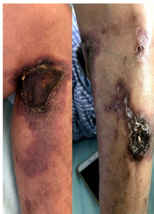
Figure 3. Multiple gangrene in the lower extremities