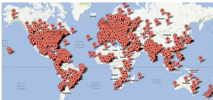
Figure 1. Distribution of the attendances of “Internet History, Technology, and Security” 图 1. 2012 年 “Internet History, Technology and Security” 选课人数分布图

这两年，国内 MOOC 相关实践的数量在逐年攀升，有关 MOOC 的研究和学术研讨活动也丰富多彩，郝丹对国内的研究做了很好的分类和总结[7]。