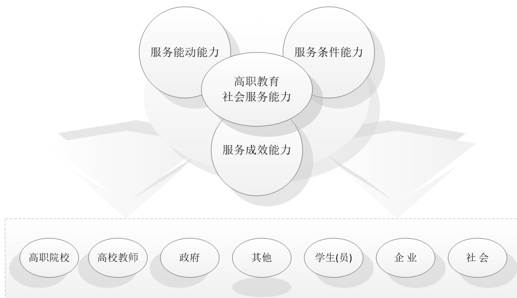
Figure 2. Evaluation framework of social service ability in Higher Vocational Education Based on project management