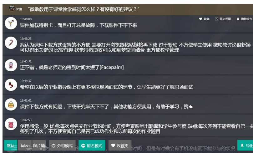
Figure 4. Screenshot of discussion function in micro teaching assistant platform 图 4. 微助教平台中讨论功能截图

3) 微助教的讨论功能。晚讲评是高校辅导员开展思想政治教育活动的主阵地，对于思想政治教育，也可以通过一个讨论题目来引发大学生的思考，让大学生主动“发声”，积极开展讨论，然后通过同学们的发言来引出主题教育(如图 4 所示)。