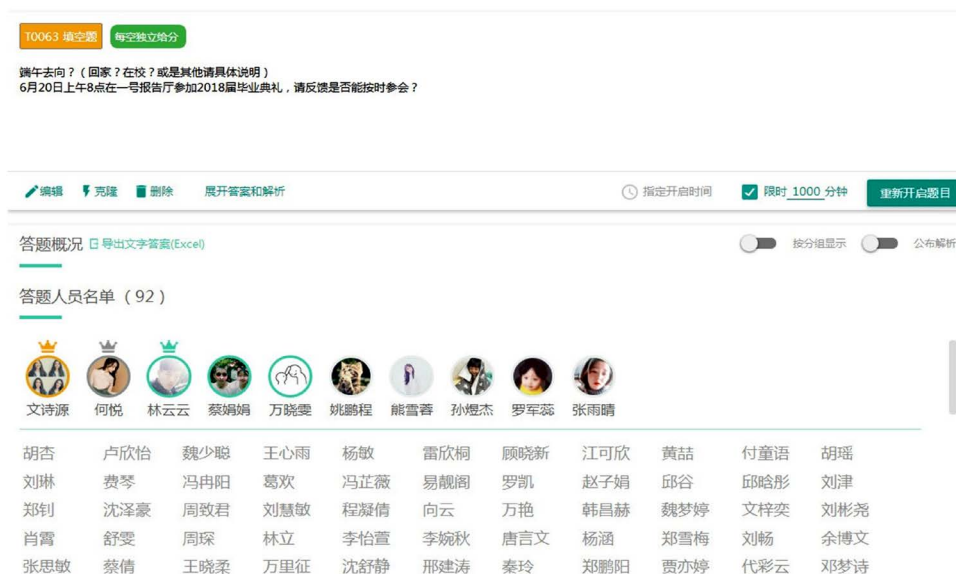
Figure 5. Screenshot of answer function in micro teaching assistant platform 图 5. 微助教平台中答题功能截图

4) 微助教的答题功能。最值得推崇的是它的答题功能。现在的版本可以快速导入测试。在课堂前几分钟可以快速的实现实时测试,不需要打开网页平台,也不需要耗费很多流量。对于 90 后的学生的情况来讲,流量不是问题。我们做过测算,一个 5 分钟的小测试,可以统计出学生的各项基本情况比如:节假日的去向表,毕业生在外实习的进展,学分统计等,只需要大概 2M 的流量,需要的流量很低。辅导员可以快速导出试题的完成情况(如图 5 所示)。