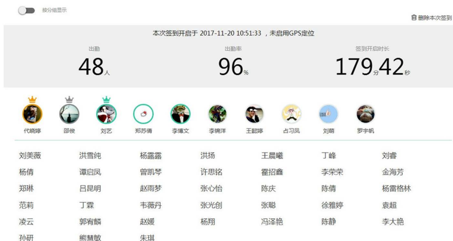
Figure 3. Screenshot of check-in function in micro teaching assistant platform 图 3. 微助教平台中签到功能截图

2) 微助教签到功能。可以在晚点名期间，查课期间，晚查寝期间开启微助教的签到功能，设置 5 分钟时间，签到结束之后可以清晰的查看同学们的出勤情况，因为在学生的座位不确定，人数较多的情况下，使用这个黑科技，可以有限防止代签到，不到的情况。图 3 中前 10 名学生可以完整地显示个人头像，同学若均开启手机定位功能可显示师生之间的距离(如图 3 所示)。