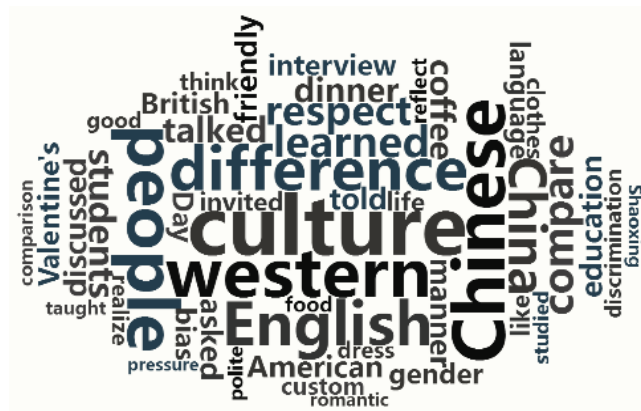
Figure 2. The word frequency of students' learning reports 图 2. 学生学习报告词频统计