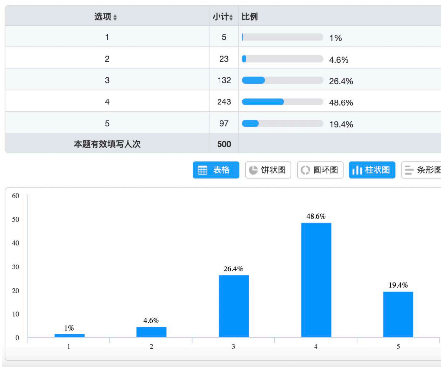
Figure 4. students' overall satisfaction towards online-flipped college English course 图 4. 学生对大学英语在线翻转课程的总体满意度调查