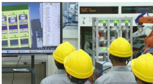
Figure 2. Group inquiry project training

课中, 教师在贴近职业化场景的“教学做”一体化实训室, 指导学生项目探究小组按照工作流程实施项目任务(见图 2), 辅以思政、职业素养要素(见图 3), 引导学生达成职业能力目标, 针对共性、难点问题适时指导并重新编排内容。