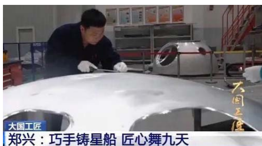
Figure 3. Integrate ideological elements