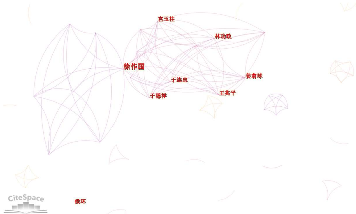
Figure 3. Statistics of authors of family psychoeducation from 1982 to 2021 图 3. 1982~2021 年家庭心理教育发文作者统计

根据洛特卡 - 普赖斯定律, 核心作者中最低产作者所发表的论文数, 等于最高产作者发表论文数的平方根的 0.749 倍, 可用公式 m = 0.749 (n_{max})^{1/2} 进行推算。其中 m 表示核心作者的最低发文量, n 表示最高产作者的发文量。