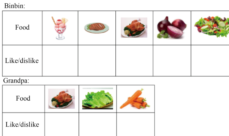
Figure 1. A-level assignment 图 1. A 层作业

能照顾到不同层级学生的个体差异性，还能提高课堂效率，同时避免了评价标准不合理的现象。在任务完成的过程中，相近层级的学生相互合作，共同思考，同时还能激发学生的竞争意识，实现了在语篇教学过程中的良性竞争，有利于帮助各个层级的学生提高语言能力。