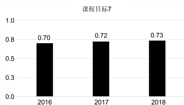
Figure 7. Achievement of the graduation design course objective 7 of the 2016~2018 class

在图6中,课程目标6达成情况在三年间呈现小幅波动趋势,主要原因是由于在教学日常环节中,对于环境保护与可持续发展理念与内涵诠释力度欠缺,导致学生在开展毕业设计实践活动时,未能将环境保护与可持续发展理念在毕业设计作品中较好体现。为进一步优化课程目标6达成情况,未来可考虑发展产教融合、区域合作,实现工程育人深度融合的“基地教学”,或是在教学过程中引用专题案例以及情景式教学,引导学生进行课程设计实践,使学生又能力在毕业设计中正确评估毕业设计实践对环境保护和可持续发展的影响[7]。