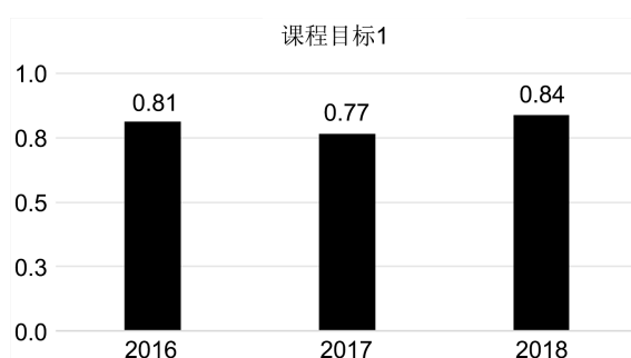
Figure 1. Achievement of the graduation design course objective 1 of the 2016~2018 class

安徽科技学院通过收集分析 2016~2018 级近 3 届学生(2016 级 94 人、2017 级 142 人、2018 级 105 人)的毕业设计数据作为样本,对当前毕业设计存在的一些问题,以及未来改进毕业设计的一些方向进行分析论述。