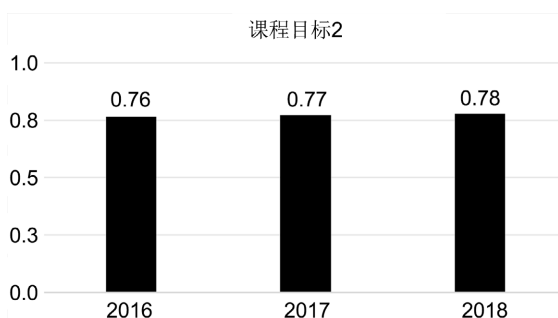
Figure 2. Achievement of the graduation design course objective 2 of the 2016~2018 class

师监督学生文献调研并针对问题答疑更加方便,因此相对 2017 级学生,2018 级学生课程目标 1 达成度明显回升。为进一步优化课程目标 1 达成情况,导师可要求学生每周撰写读书笔记,并定期汇报。在导师指导毕业设计时,也可提出多种设计方案帮助学生开拓思维,进一步使学生在解决复杂工程问题时有寻求可替代方案不断优化现有方案的意识。