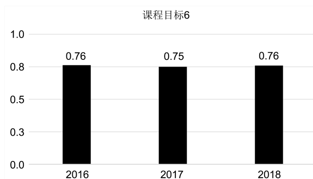
Figure 6. Achievement of the graduation design course objective 6 of the 2016~2018 class

在图 5 中, 课程目标 5 近三届学生达成情况呈稳步提升趋势, 这代表在 2016~2018 级学生的培养过程中, 校方重点加强了现代工程软件的应用能力培养; 其次, 自媒体平台迅速发展, 各种现代工程软件的教程层出不穷, 使学生自学软件的难度大大降低; 同时, 工程软件在不断的版本更新换代中, 操作难度降低以及面板配置的优化也使学生的学习效果有效提升; 最后, 随着现代科学技术高速发展, 无论是学校机房电脑还是学生自己的电脑都在向智能化、快捷化发展, 电脑操作的快捷性, 可以使学生在有限的时间内, 完成更多的有效操作, 减少响应时间, 加速提升工程软件的应用熟练度。目前本校已经开设的软件课程覆盖二维绘图、三维建模及仿真、控制系统分析、数值计算及其数学建模, 基本涵盖学生短期内的应用需求, 未来提升方向可考虑针对性开设有关算法、图像处理等方面工程应用软件的选修课, 以满足不同学生提升个人软件应用能力的需求, 指导教师毕业设计出题过程中可考虑不同学生擅长的工程软件应用方向因材施教, 选择更加贴合学生研究兴趣的毕业设计课题。