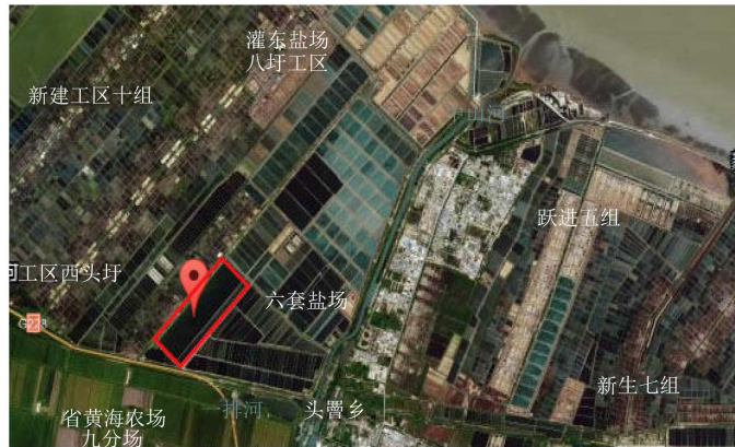
Figure 1. Schematic diagram of satellite remote sensing imagery in afforestation 图 1. 造林地卫星遥感影像示意图