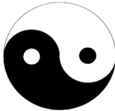
Figure 1. A perfect diagram of yin and yang fish 图 1. 完满状态的双鱼图