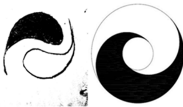
Figure 2. Diagram of Yin and Yang Fish in the early state of life 图 2. 生命早期状态的双鱼图

“两条鱼”在“点”周围汇聚，于是在有生命的那一刻便生成着“我”。生命在与外部的自然界和人际中不断经验与抉择，通过内化与建构分别于两方。一方包含限制、规范、伦理等，另一方包含欲求、冲动、享乐等，然后渐渐形成“审美我”与“伦理我”。