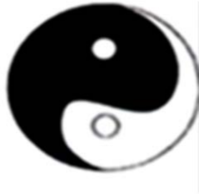
Figure 3. The adolescence is dominated by aesthetic ego 图 3. “审美我”占优势的青少年期及青春期

如图 4, 以“伦理我”总是占优势的成年期。当个体意识到自我是一个开放性的自我, 发现“伦理我”也是自己的一部分。个体拥有了完整的自我意志, 学会并选择了承担责任: 成为一个丈夫、从事一种工作、承继一个家庭等。在工作、婚姻等事务中实现着自己的价值和意义, 体验着自己的存在。而他们履行的伦理道德是一种内在的, 即这种伦理或道德就是他自己——指代“白鱼”的“鱼头”部分。比如当触犯道德和伦理时自己的情绪表现, “道德以情绪的态度流出……对人来说, 不是强制性的, 而是主体自觉的精神皈依。”(余开亮, 2015)或者他们履行的是一种外在的, 即他自己未真正的做出选择, 是被迫的投入到某事务——指代“白鱼”的“鱼尾”部分。简单来说, 他们在“伦理”中体验着责任的永恒性, 践行着存在的意义。